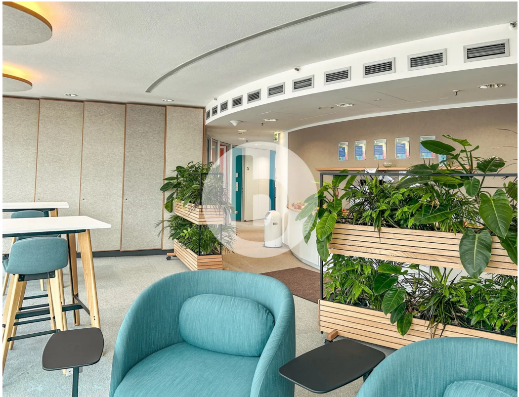
14. OG - Innenansicht