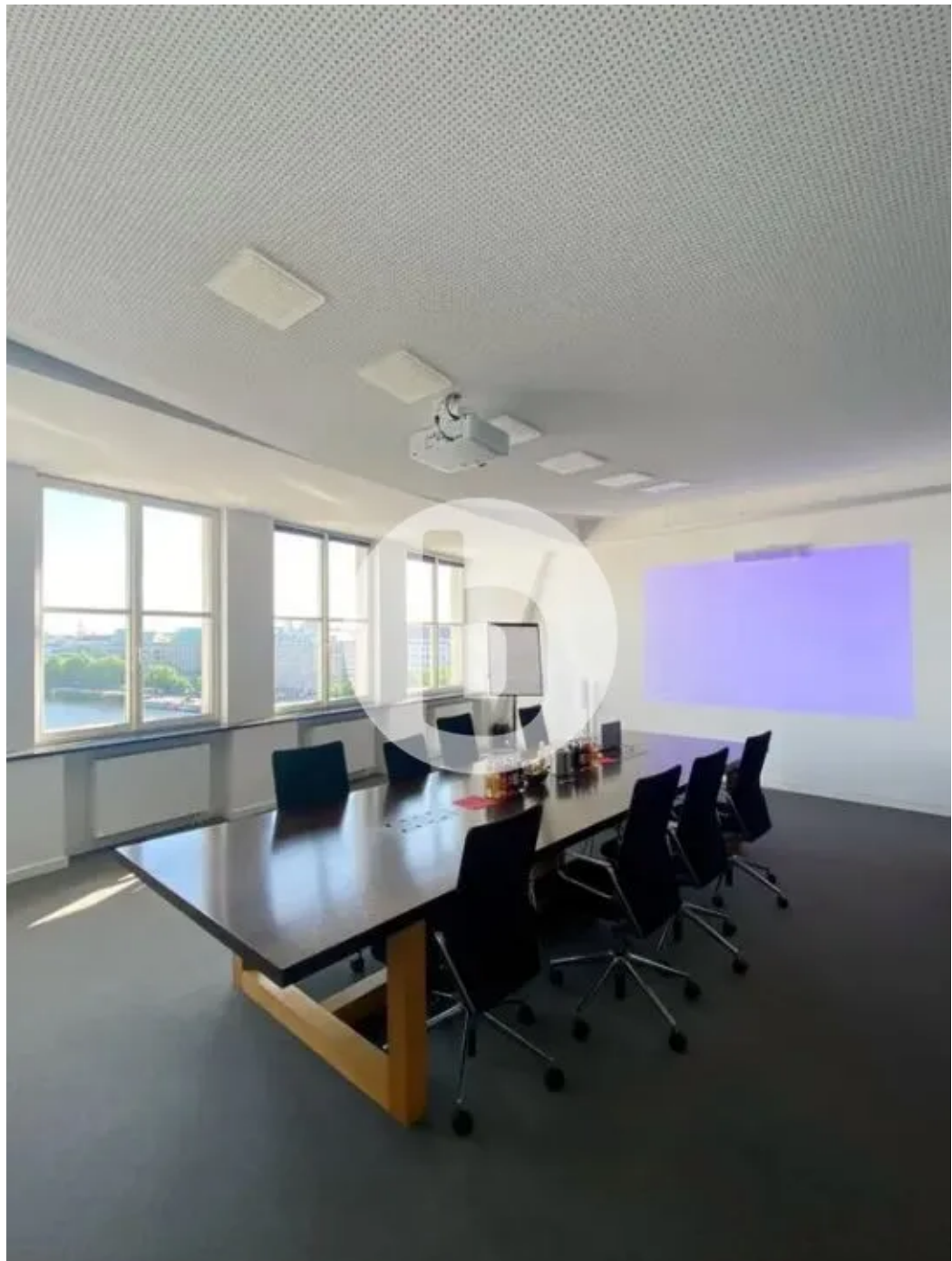
Innenansicht - 6. Obergeschoss