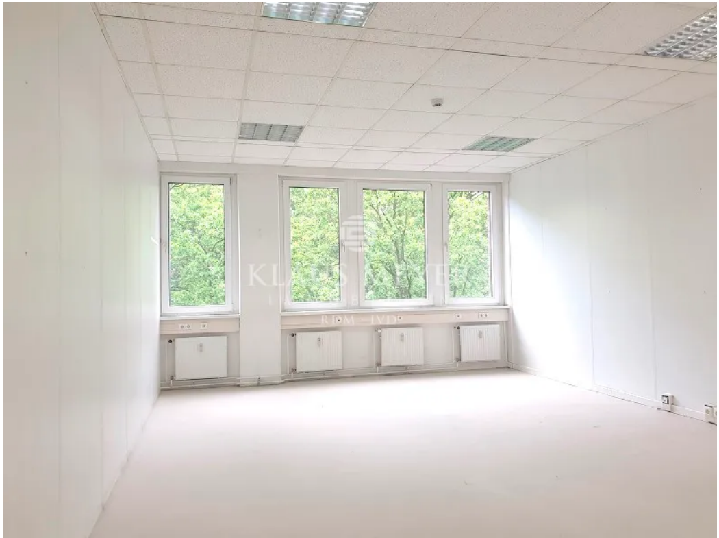
Ausbau nach Wunsch