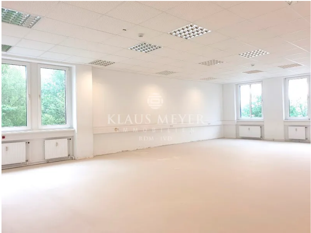
Ausbau nach Wunsch