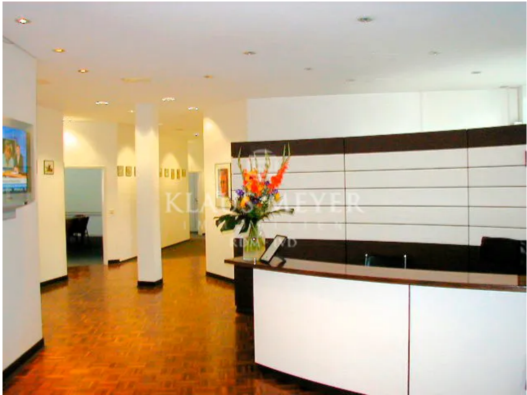
Beispiel aus anderer Etage