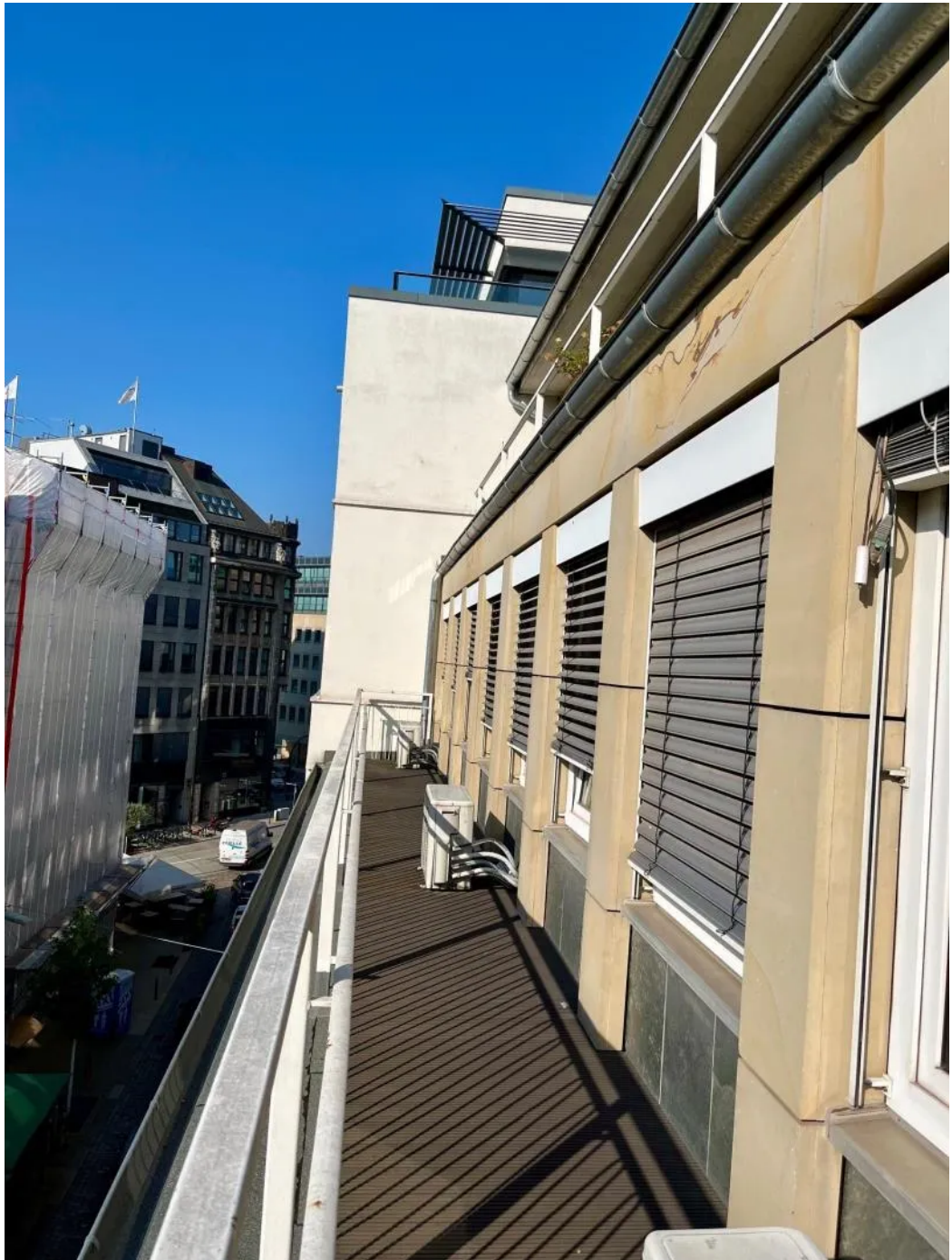
Impression 4. OG