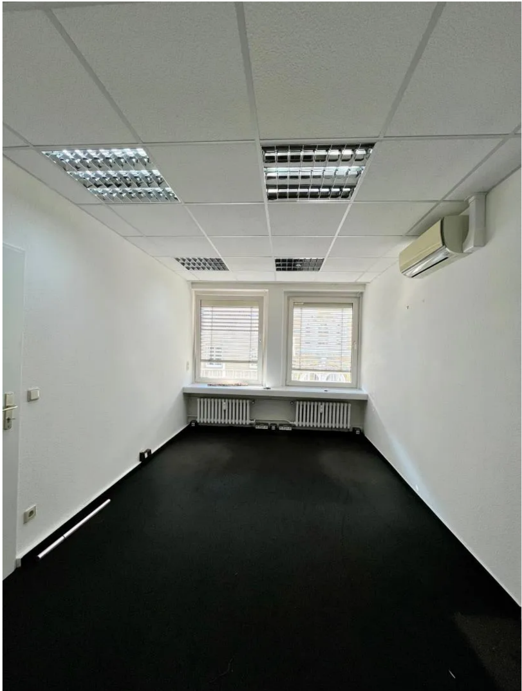
Impression 4. OG