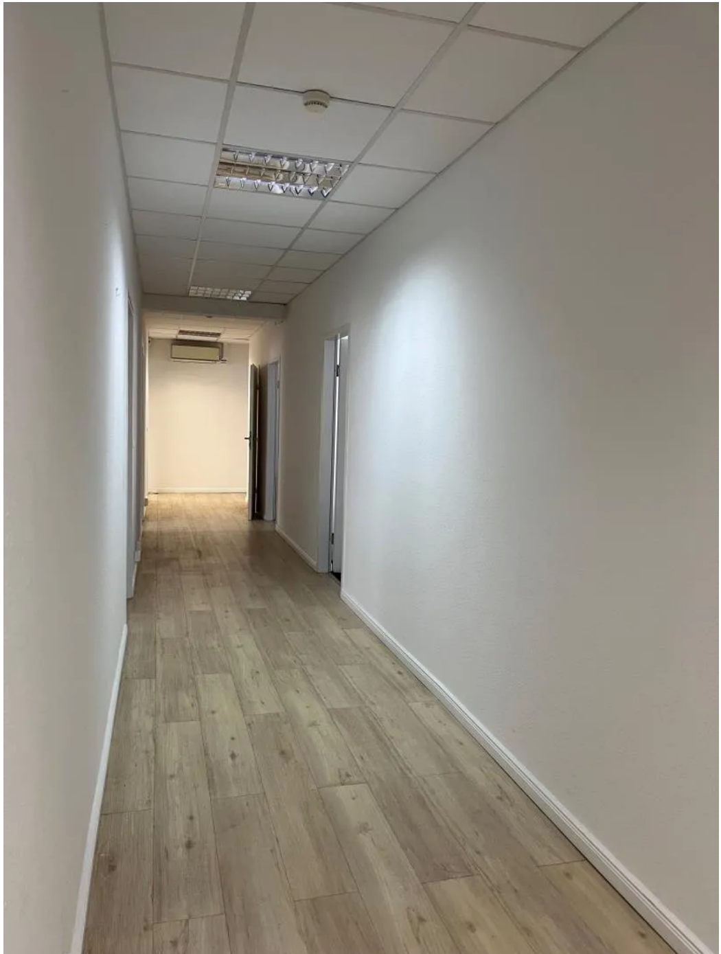
Impression 4. OG