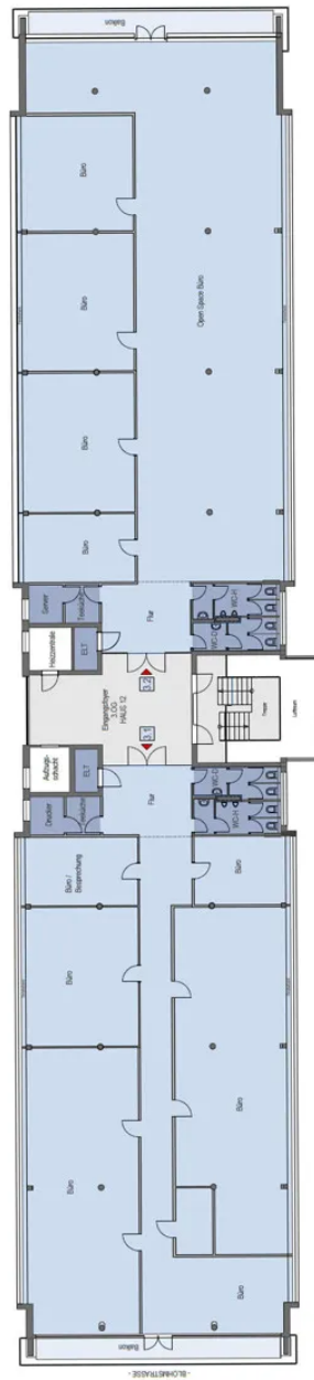
Grundriss 2. OG