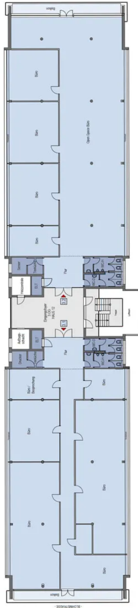
Grundriss 3. OG