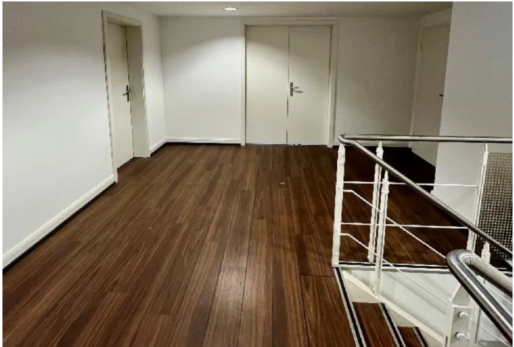
Flur OG 3