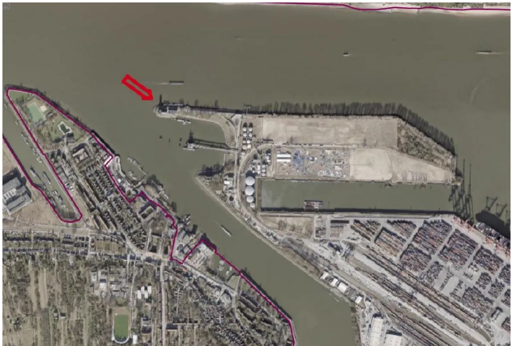
Lage des Objektes