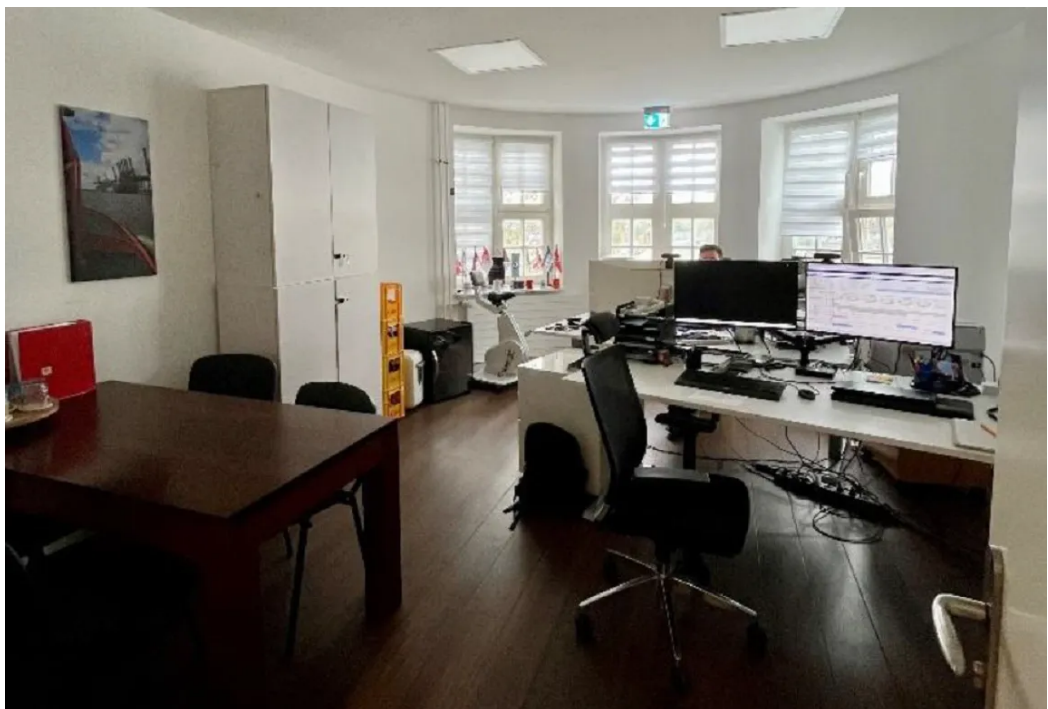
Büro 2 im OG 2 (links)