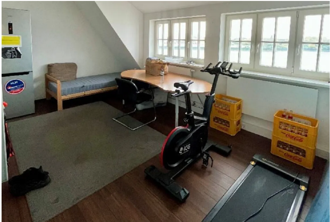
Büro 1 im OG 2 (geradeaus)