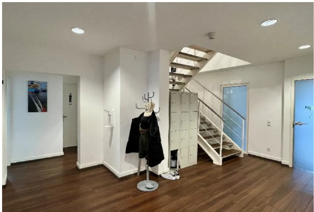
Eingangsbereich im OG 2