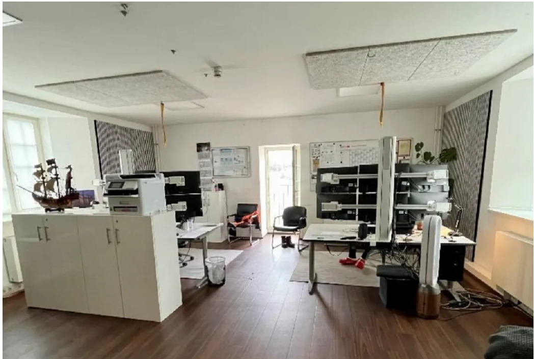
Büro 3 im OG 2 (rechts)