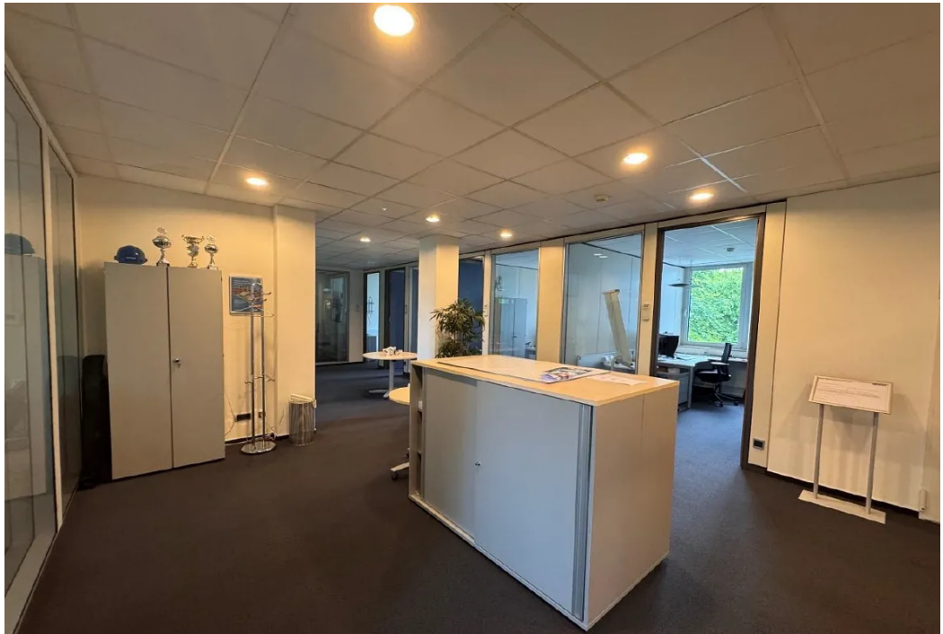
Innenansicht 1 OG 2