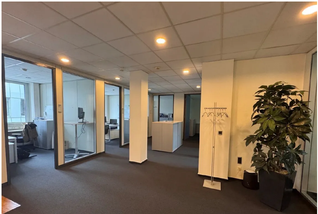
Innenansicht 2 OG 2