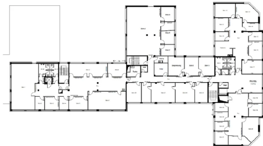
Grundriss OG 2