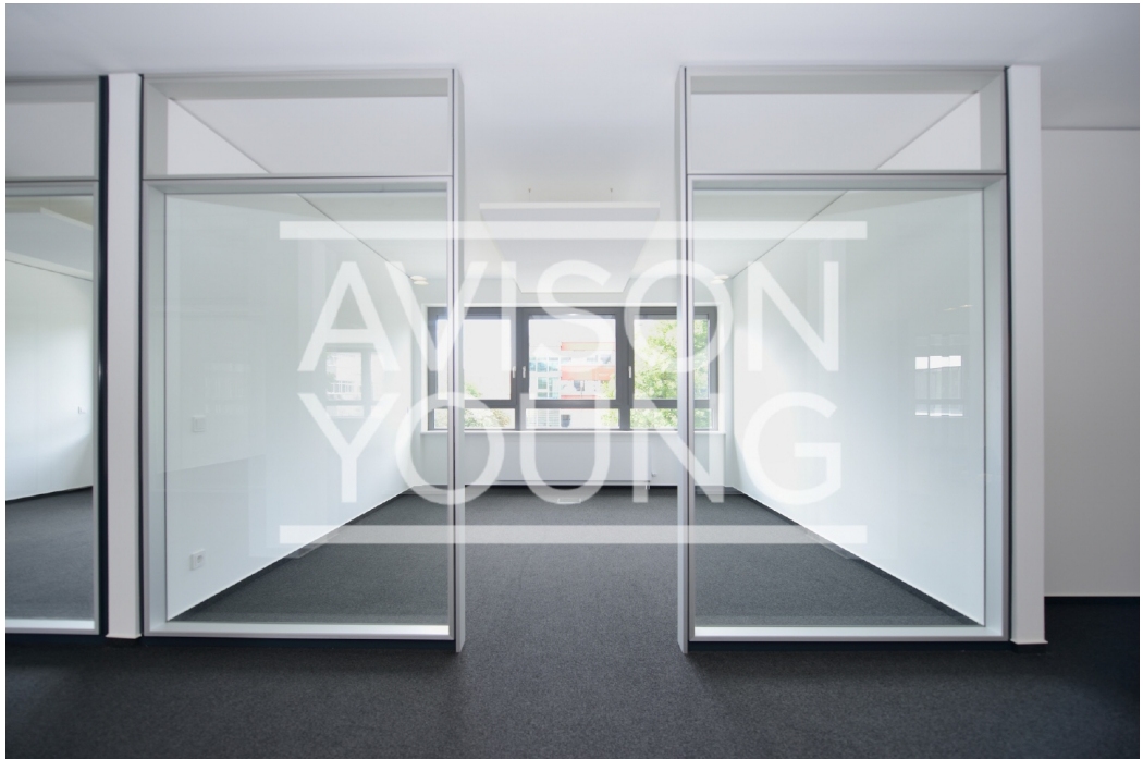
23 OG Innenansicht