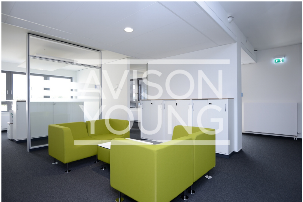
23 OG Innenansicht