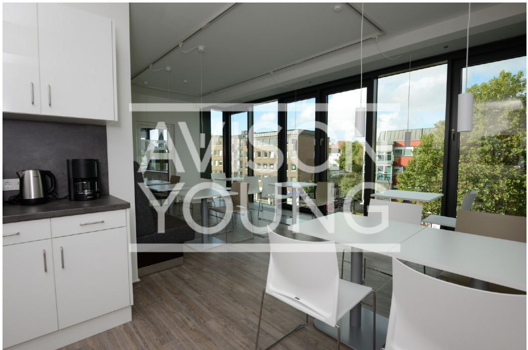
23 OG Innenansicht