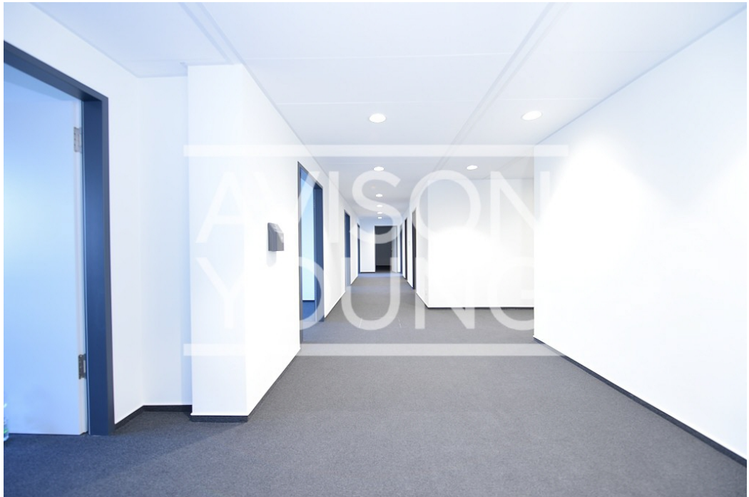
23 OG Innenansicht