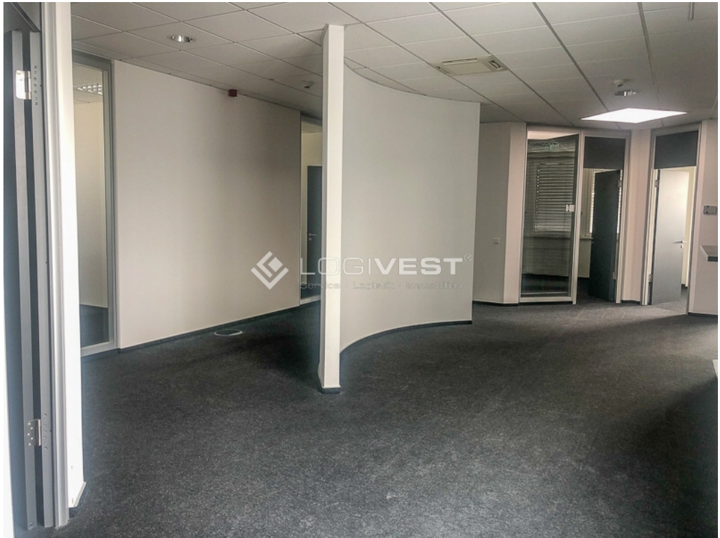
Musterbild Büro- und Sozialfläche