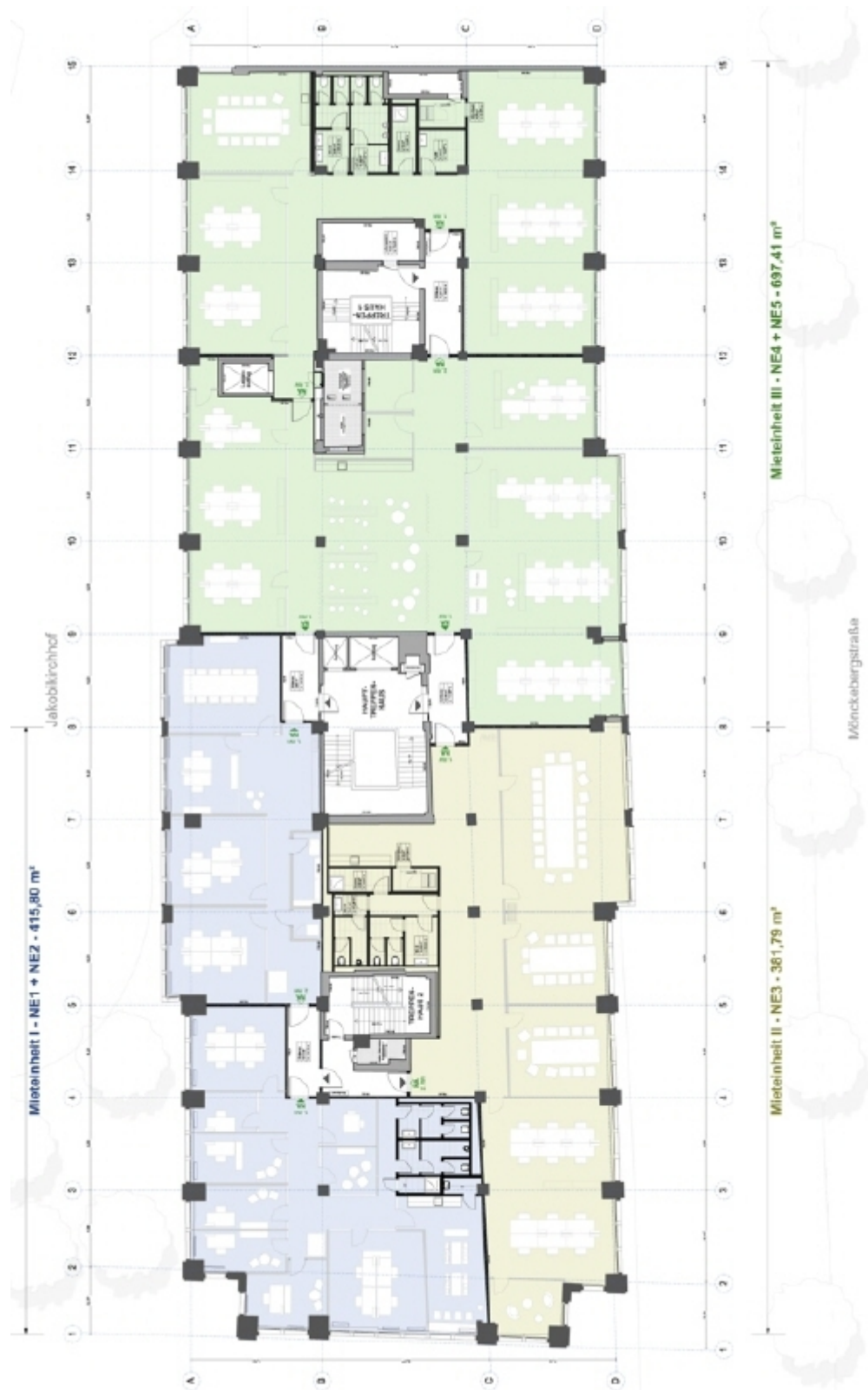
2 OG Teilung