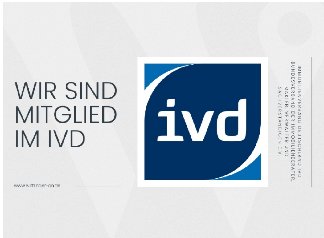
IVD Werbung Immobilienportale