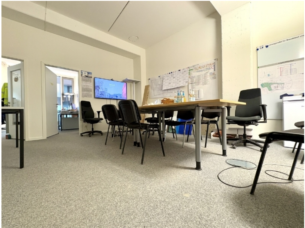
Eingangsbereich mit Meetingraum