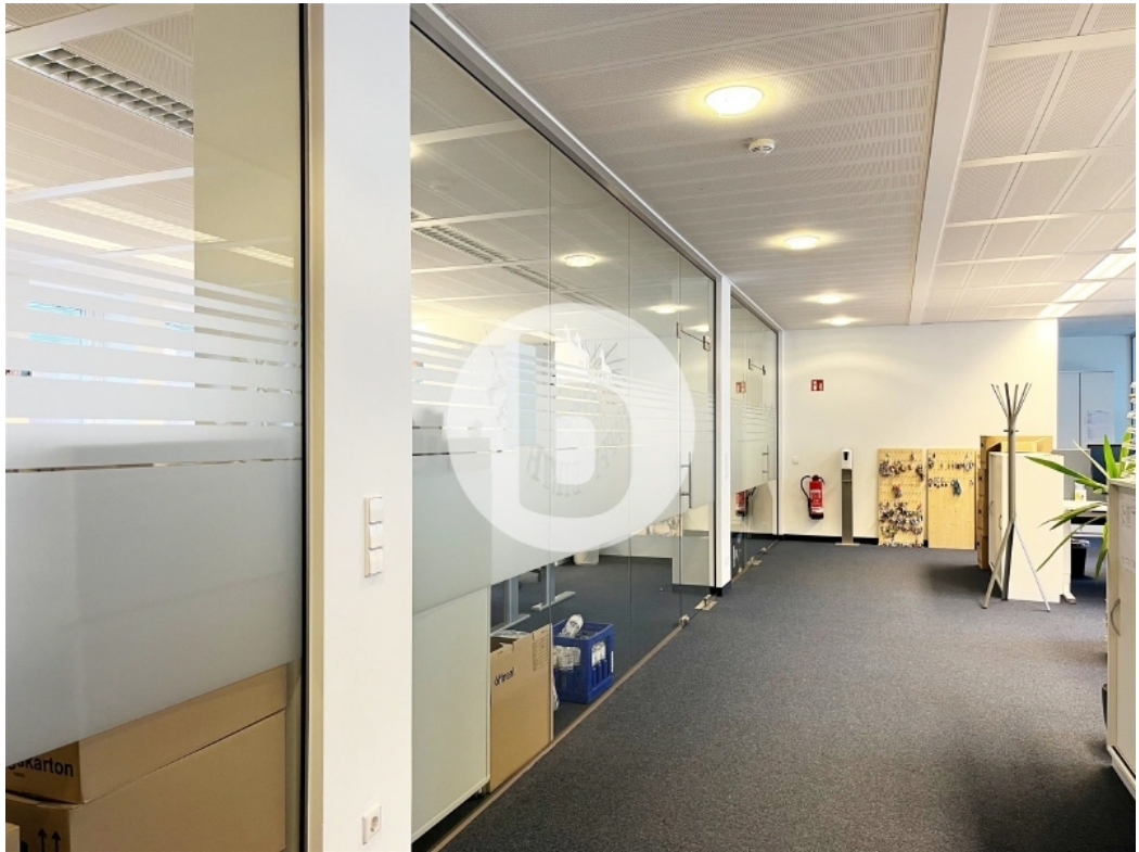
Innenansicht 1 OG