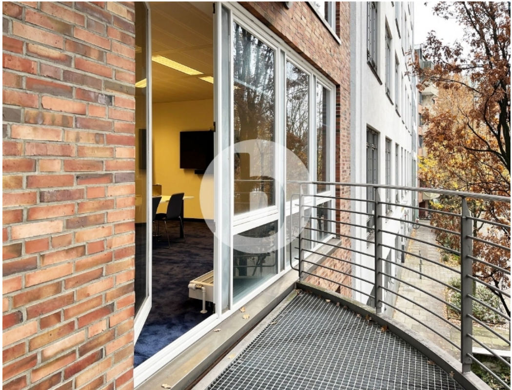
Innenansicht 1 OG