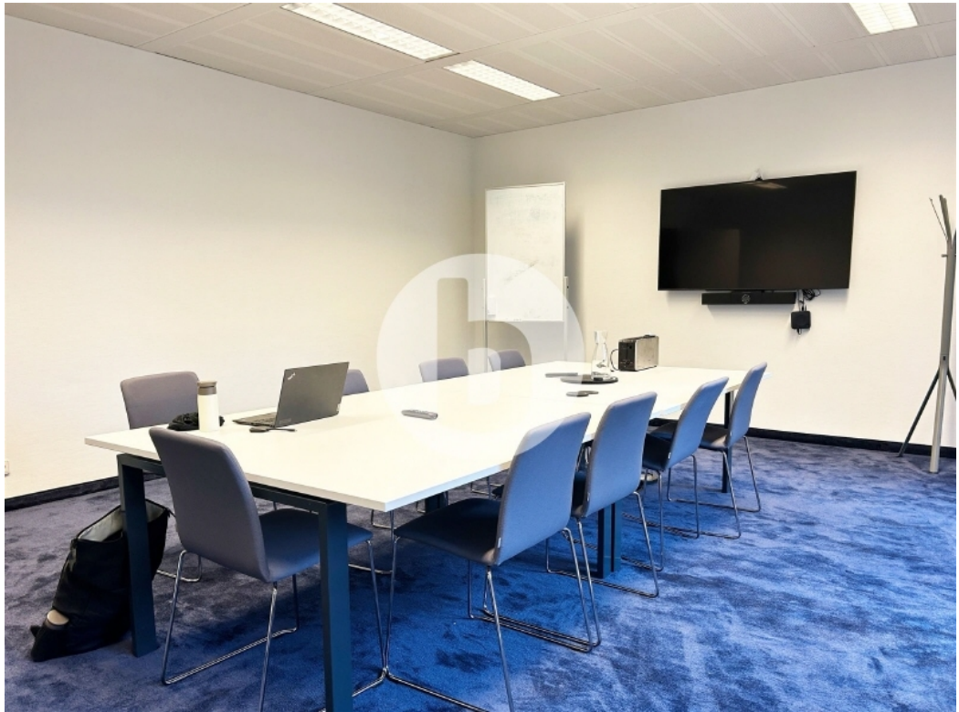
Innenansicht 1 OG