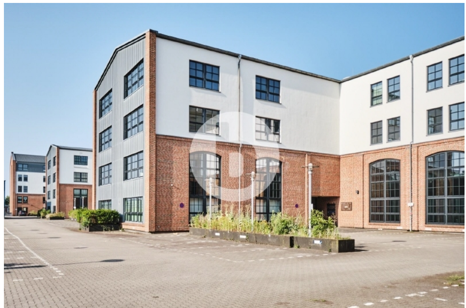
Gebäude M-P Otto von Bahrenpark Büro Hamburg Bahrenfeld Außenansicht (2)