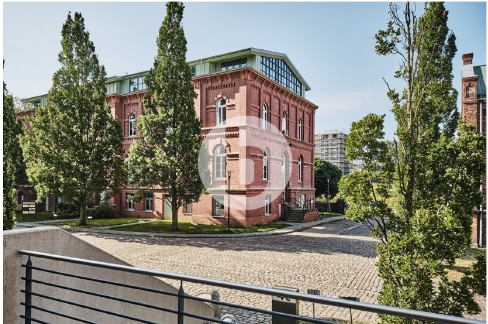
Gebäude G Otto von Bahrenpark Büro Hamburg Bahrenfeld Außenansicht 2