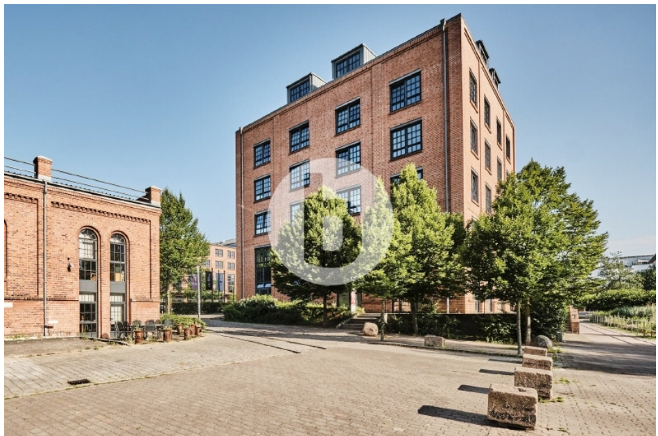
Gebäude Q Otto von Bahrenpark Büro Hamburg Bahrenfeld Außenansicht (2)