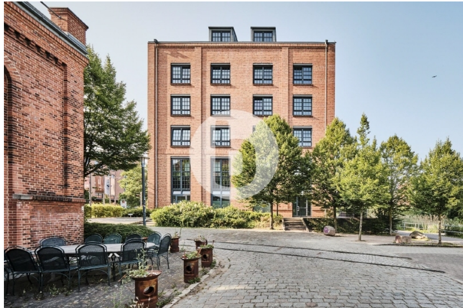
Gebäude Q Otto von Bahrenpark Büro Hamburg Bahrenfeld Außenansicht (3)