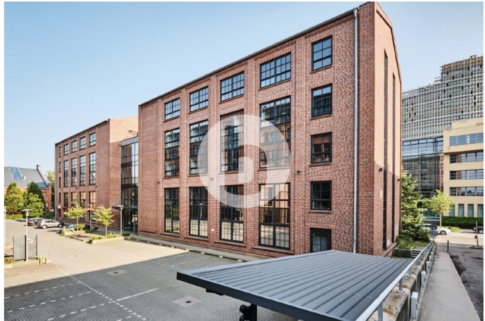
Gebäude L Otto von Bahrenpark Büro Hamburg Bahrenfeld Außenansicht 2