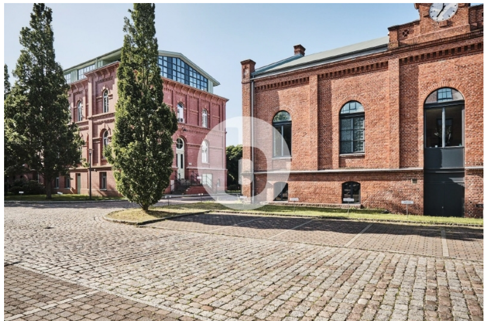
Gebäude G & H Otto von Bahrenpark Büro Hamburg Bahrenfeld Außenansicht