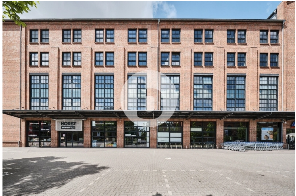
Gebäude M-P Otto von Bahrenpark Büro Hamburg Bahrenfeld Außenansicht (1)