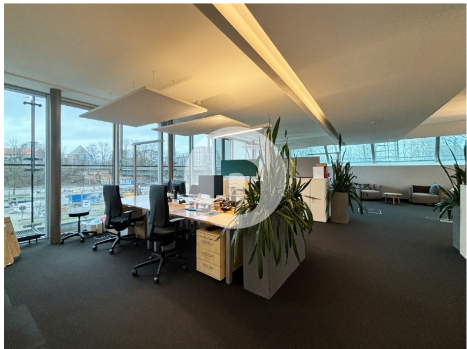
Innenansicht 1 Obergeschoss mit ca 1050 m 2