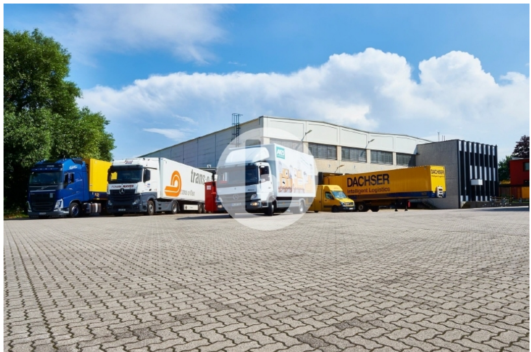
Laderampen Halle 1