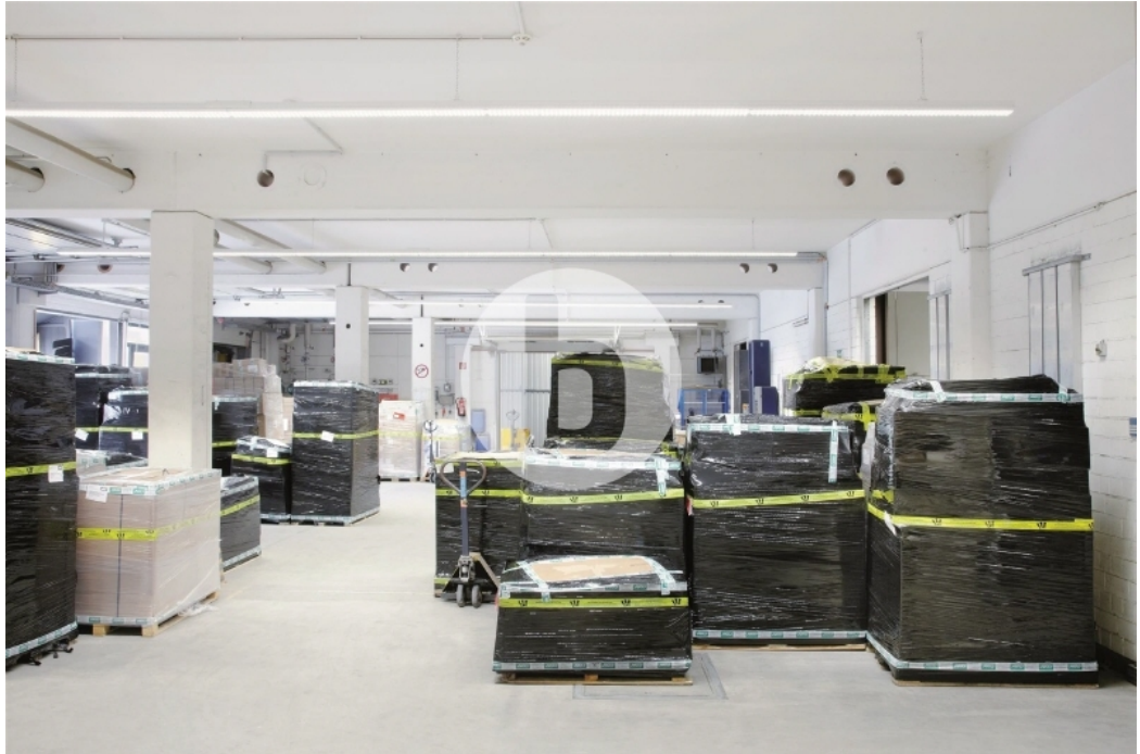
Innenansicht Halle 1