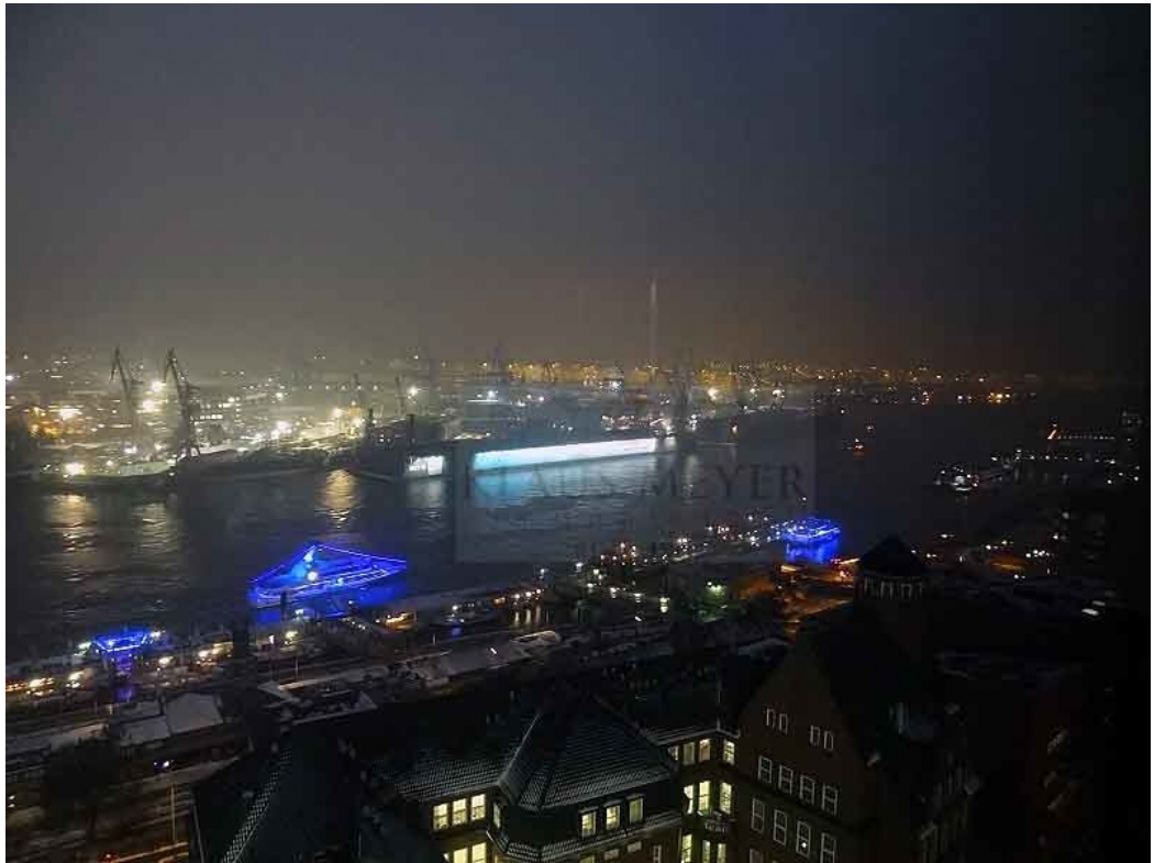
auch im Winter toll