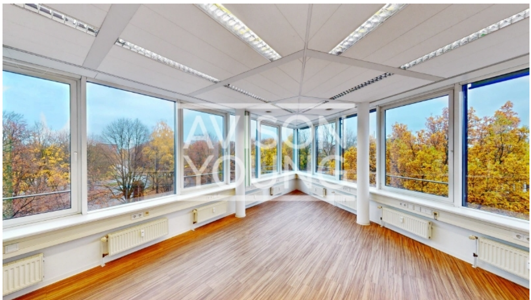
Kieler Straße 131 3 OG