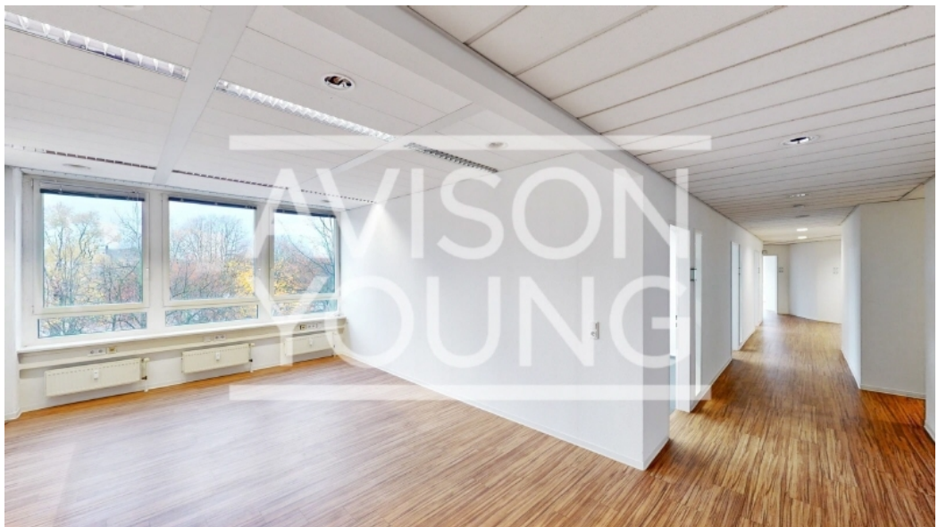
Kieler Straße 131 3 OG