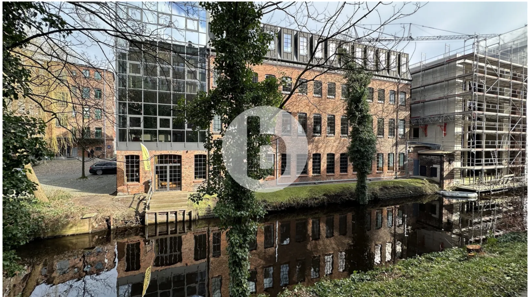
Dorotheenstraße 62-64, 22301 Hamburg, Bürofläche Außenansicht