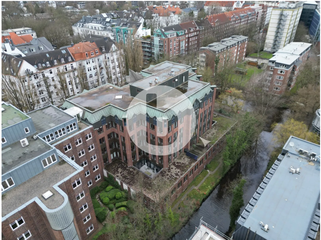
Dorotheenstraße 62-64, 22301 Hamburg, Bürofläche Außenansicht