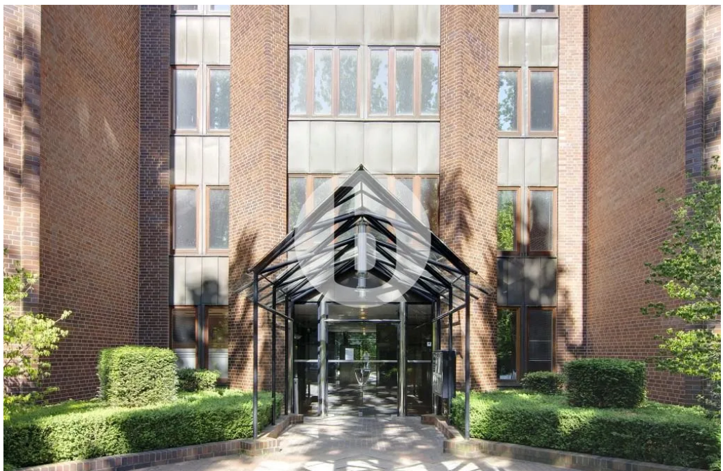
Dorotheenstraße 62-64, 22301 Hamburg, Bürofläche Außenansicht