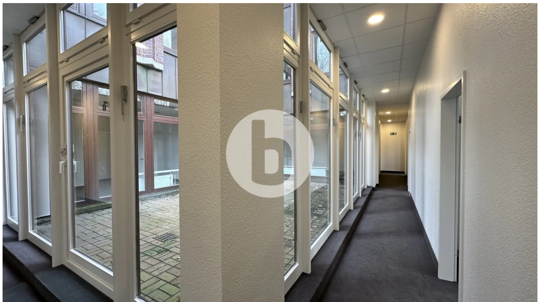
Dorotheenstraße 62-64, 22301 Hamburg, Bürofläche Innenansicht