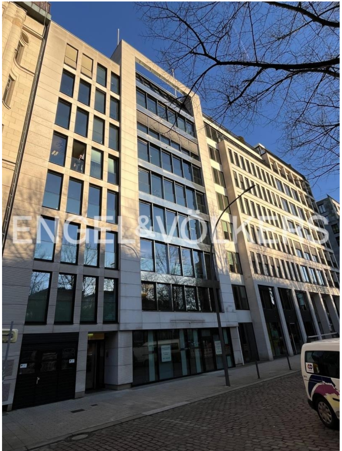
Repräsentative Bürofläche am Hopfenmarkt