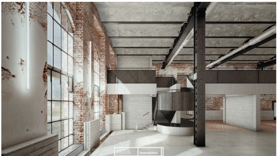
EG- Maschinenhalle 2