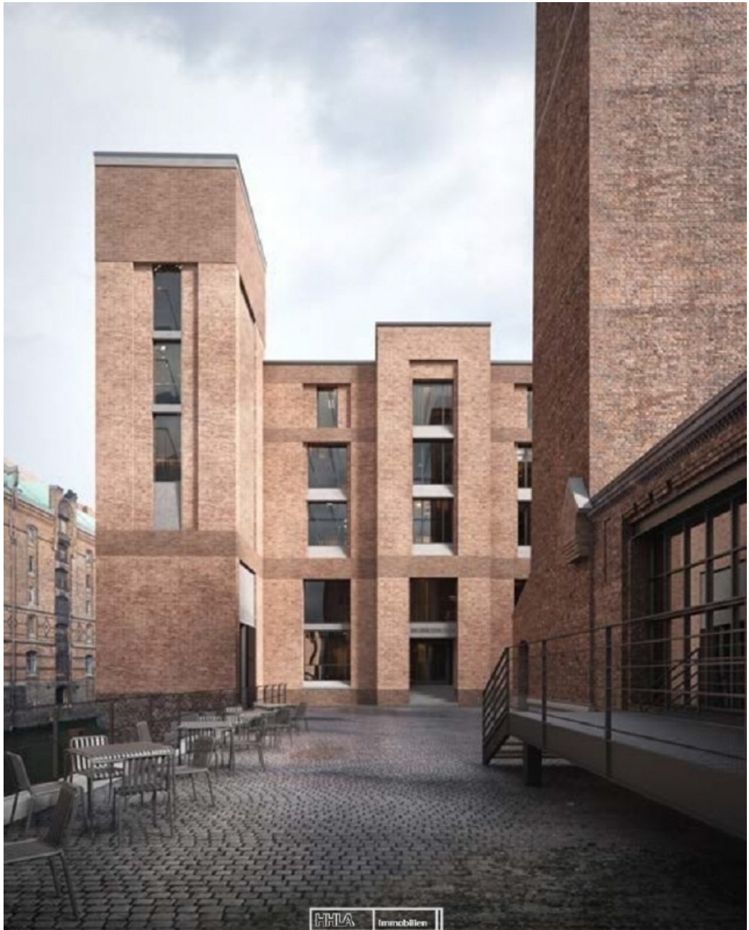
Blick auf Eingang