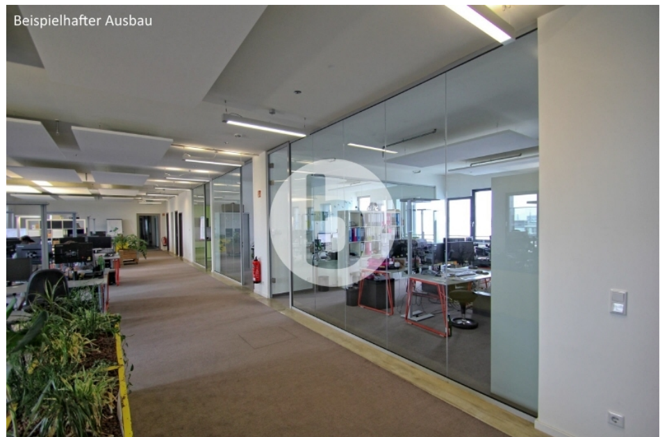
Sumatrakontor Überseeallee 1-3 Hamburg HafenCity Bürogebäude Innenansichten (2)