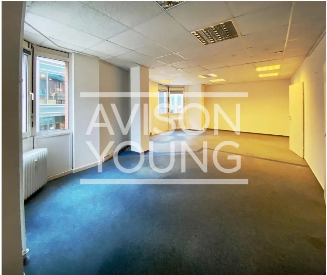
Innenansicht | Beispiel