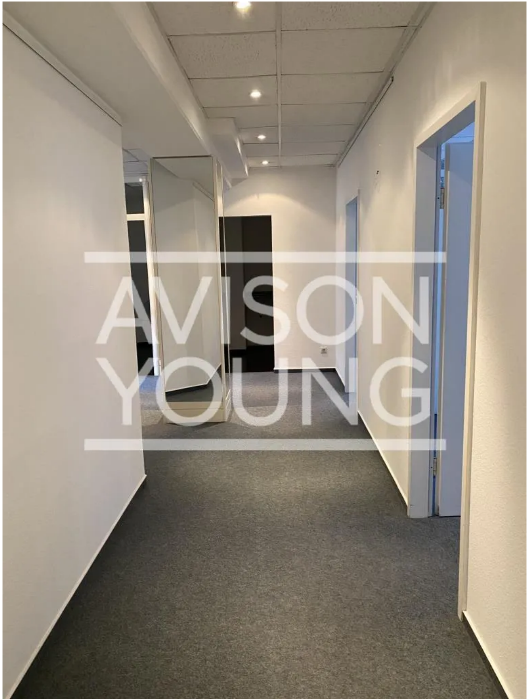
Flur I Beispiel