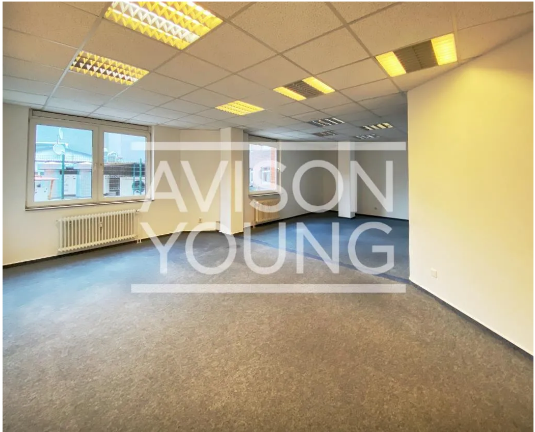
Innenansicht | Beispiel