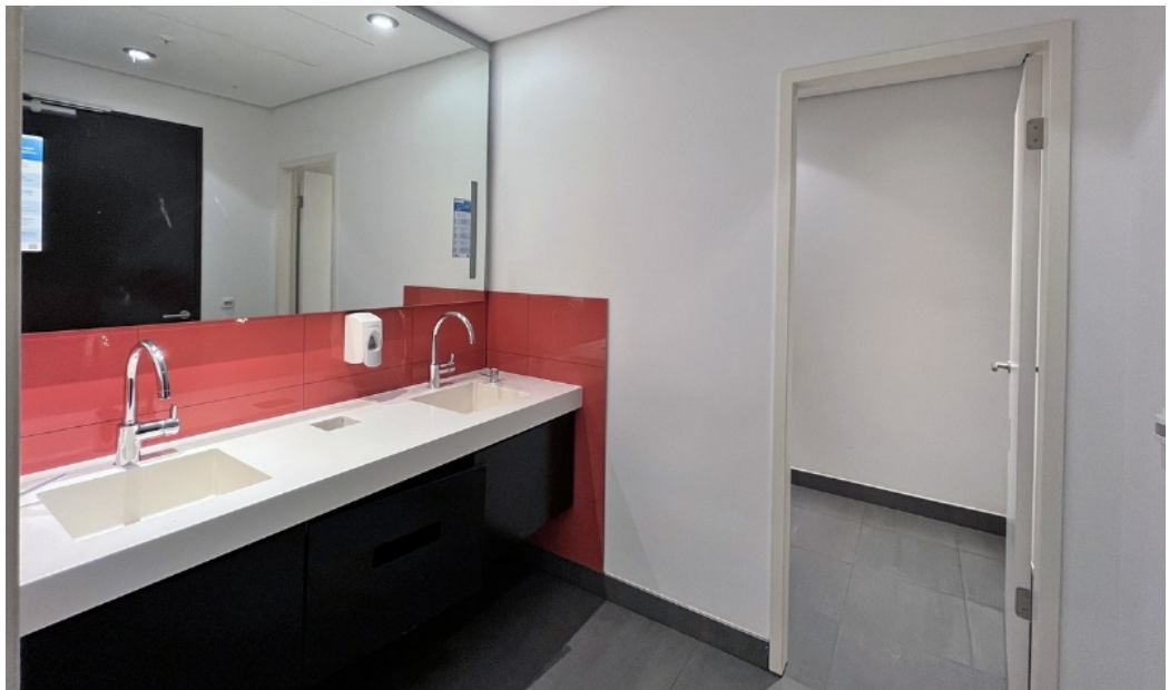
Weitere Ansichten - Beispielansicht