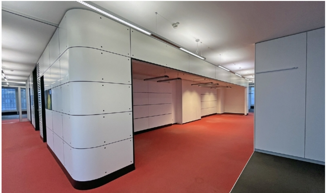
Weitere Ansichten - Beispielansicht