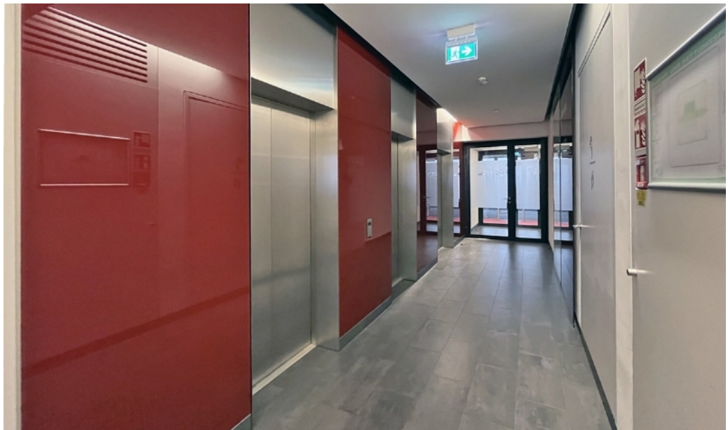
Weitere Ansichten - Beispielsicht