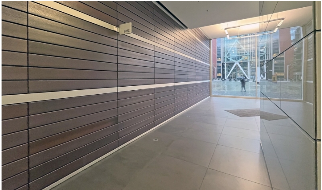
Weitere Ansichten - Beispielsicht