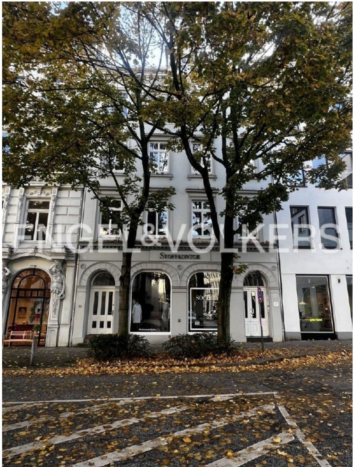
Klassisches, zentral gelegenes Bürogebäude