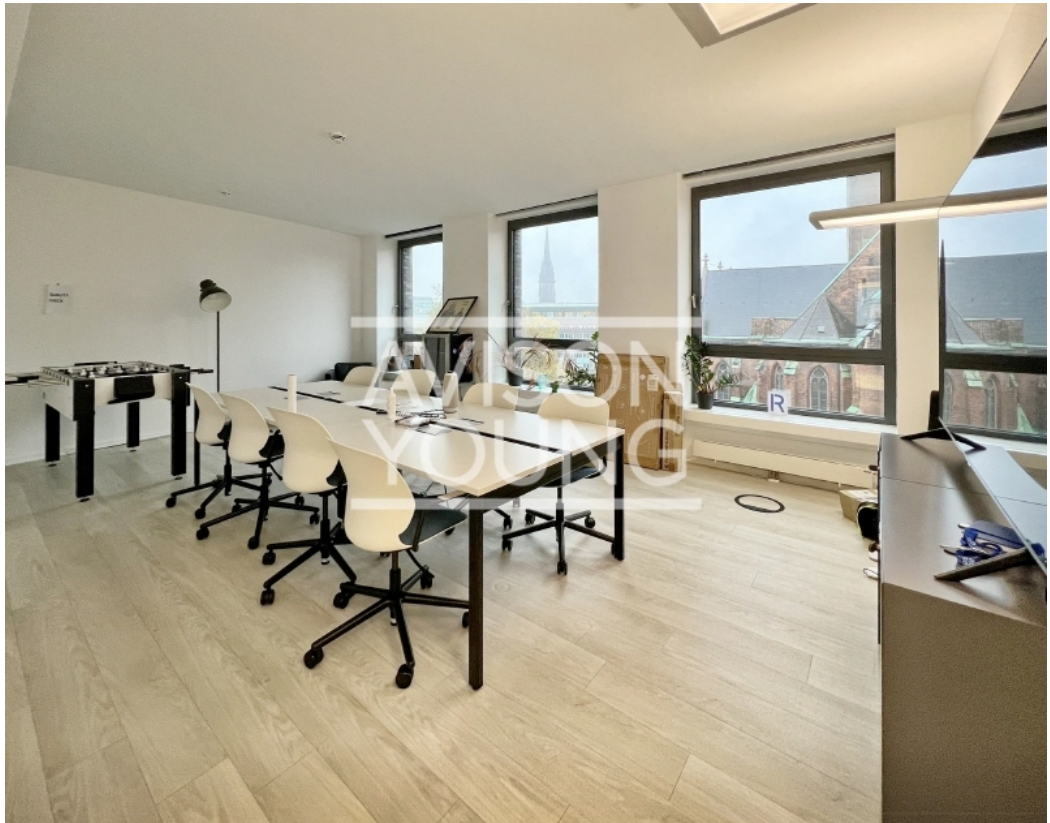
6 OG Innenansicht