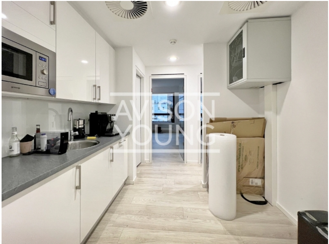
6 OG Innenansicht