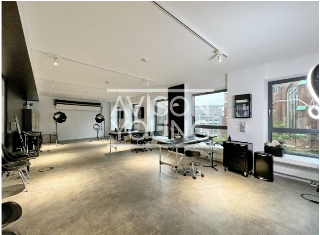
3 OG Innenansicht