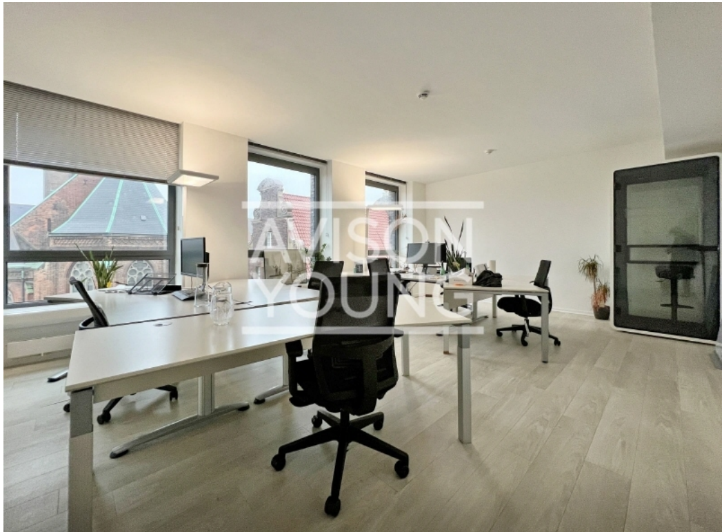
6 OG Innenansicht