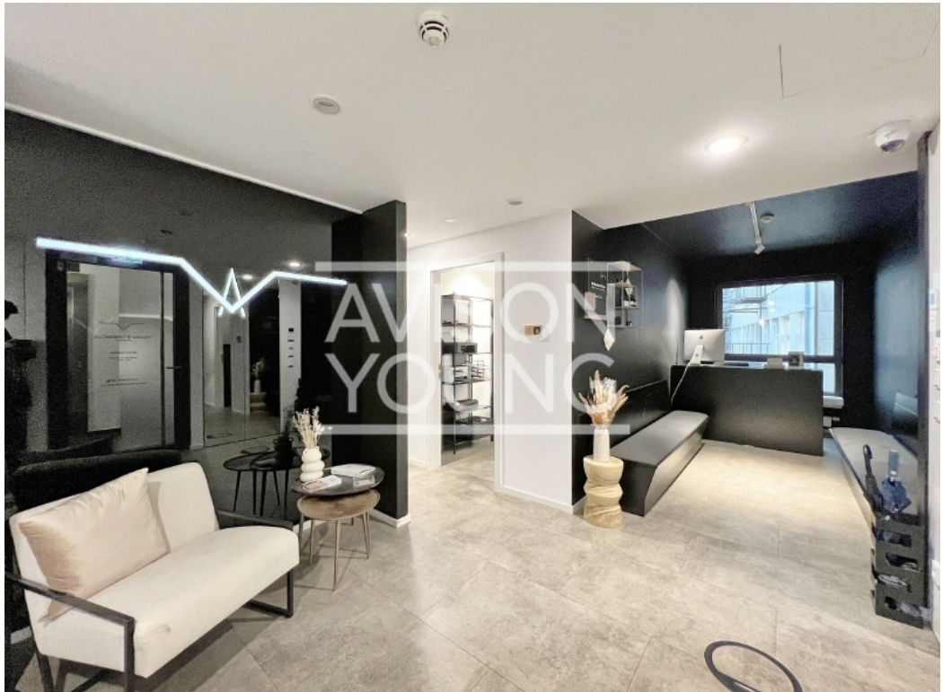
3 OG Innenansicht