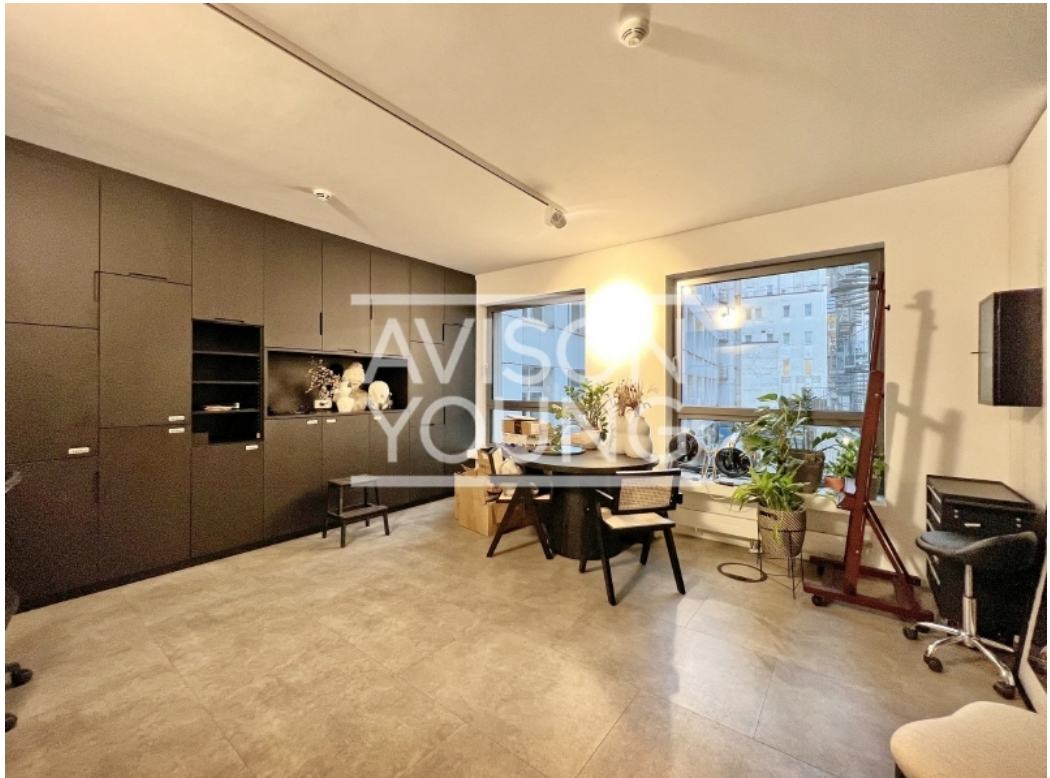
3 OG Innenansicht