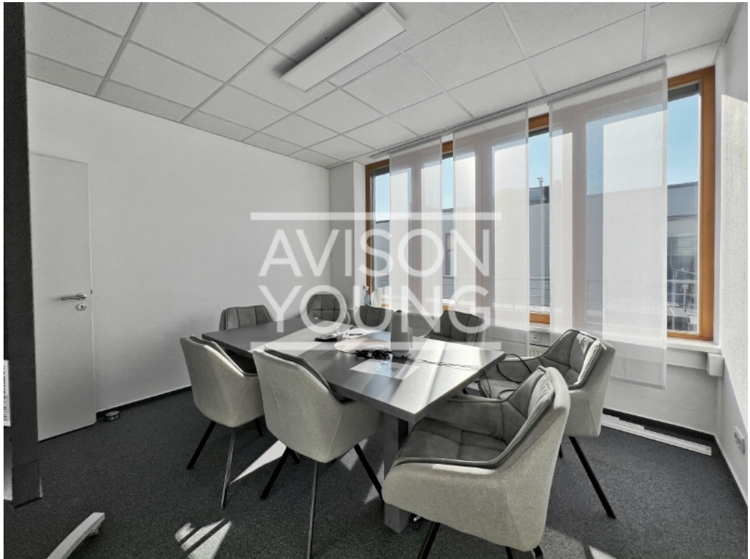
4 OG Staffelgeschoss