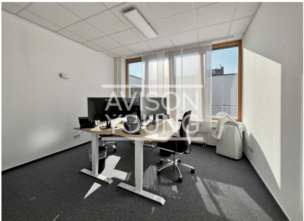
4 OG Staffelgeschoss