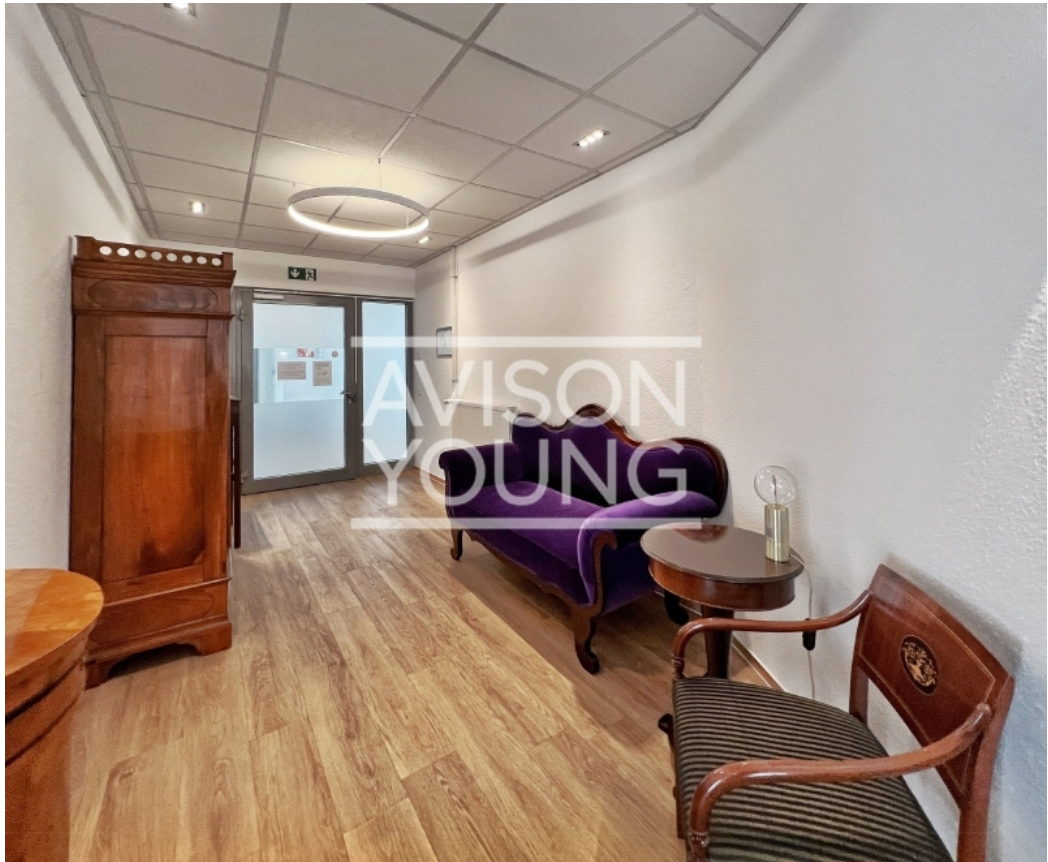
4 OG Staffelgeschoss