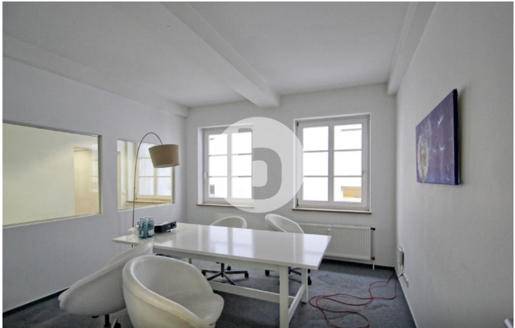
Gröninger-Haus Willy-Brandt-Straße Hamburg Innenstadt Bürogebäude Innenansicht