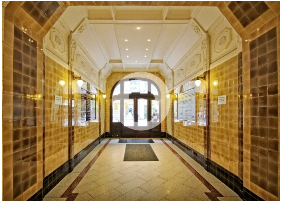
Seeburg Spitaler Straße Altstadt Hamburg Bürogebäude Innenansicht