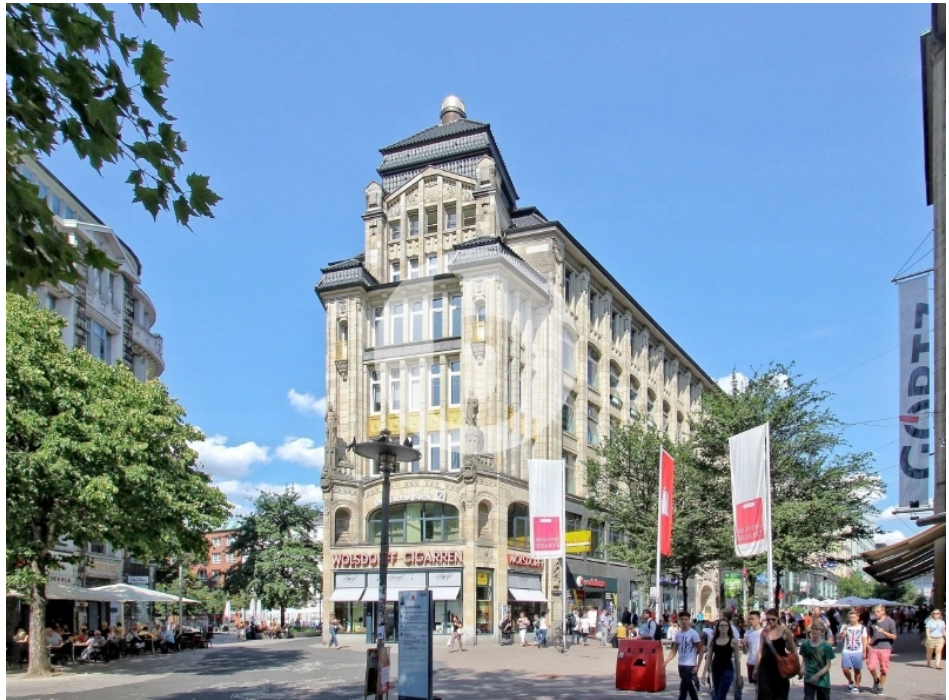
Seeburg Spitaler Straße Altstadt Hamburg Bürogebäude Außenansicht