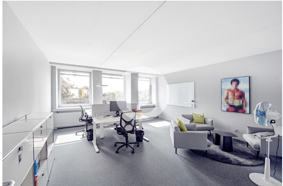
Innenansicht 4 OG