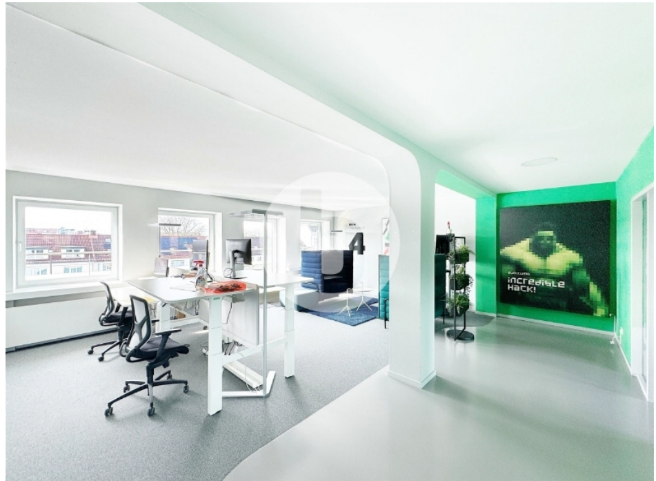
Innenansicht 4 OG