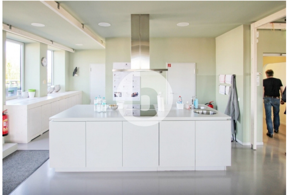
Innenansicht 5 OG