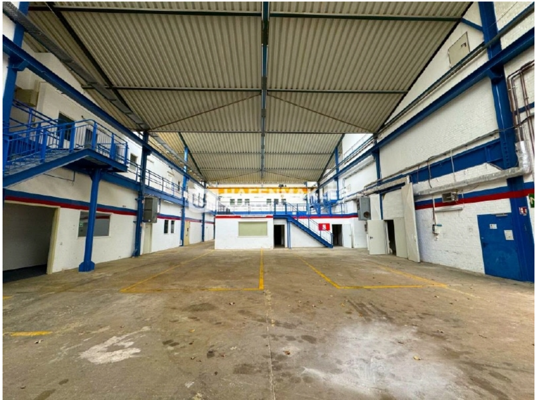
INNENAUFNAHME HALLE 2