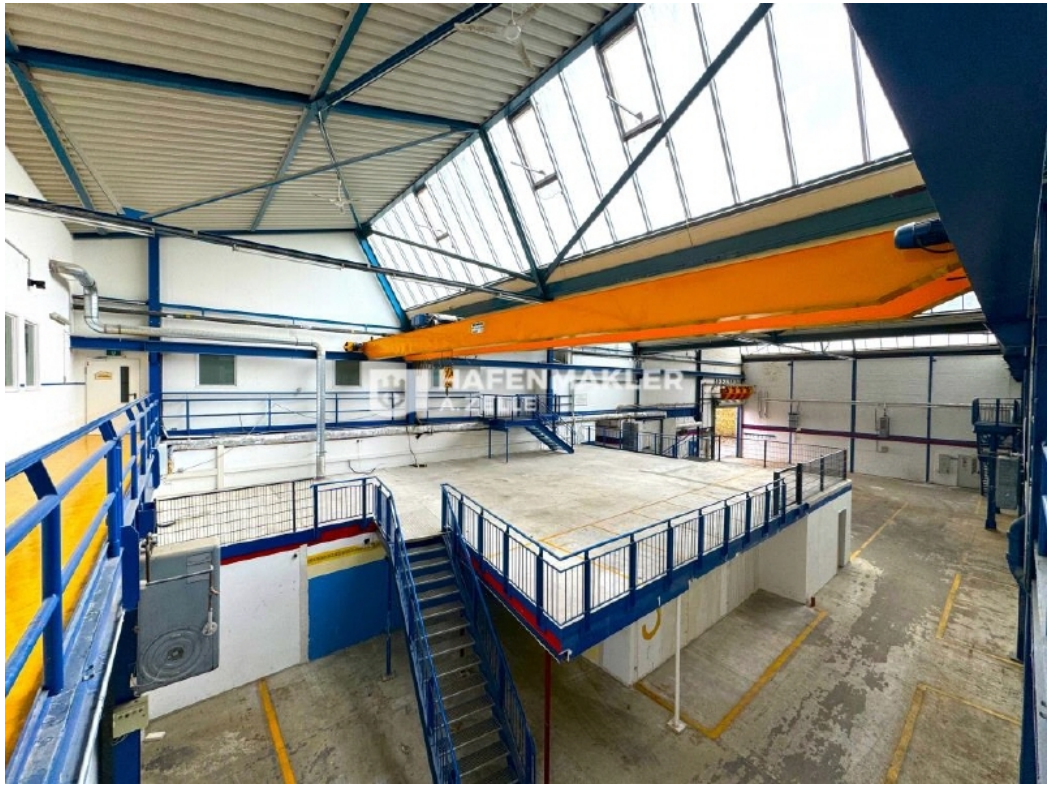
INNENAUFNAHME HALLE 4