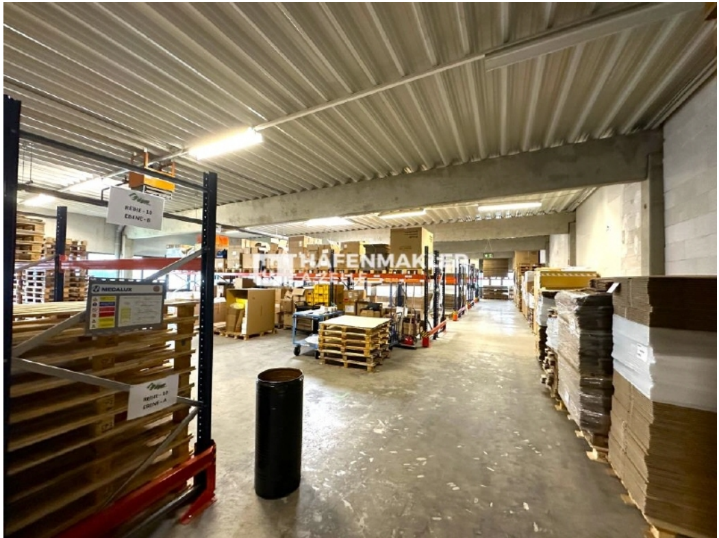
Hallen Ansicht 1