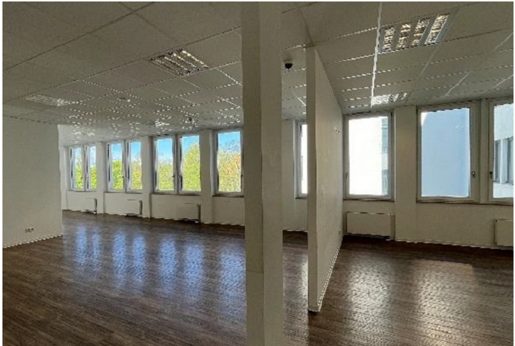
Innenansicht 2 - 3 OG