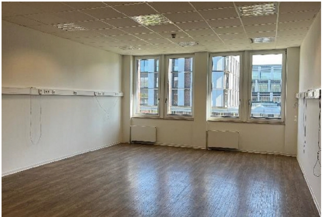
Innenansicht 1 - 3 OG