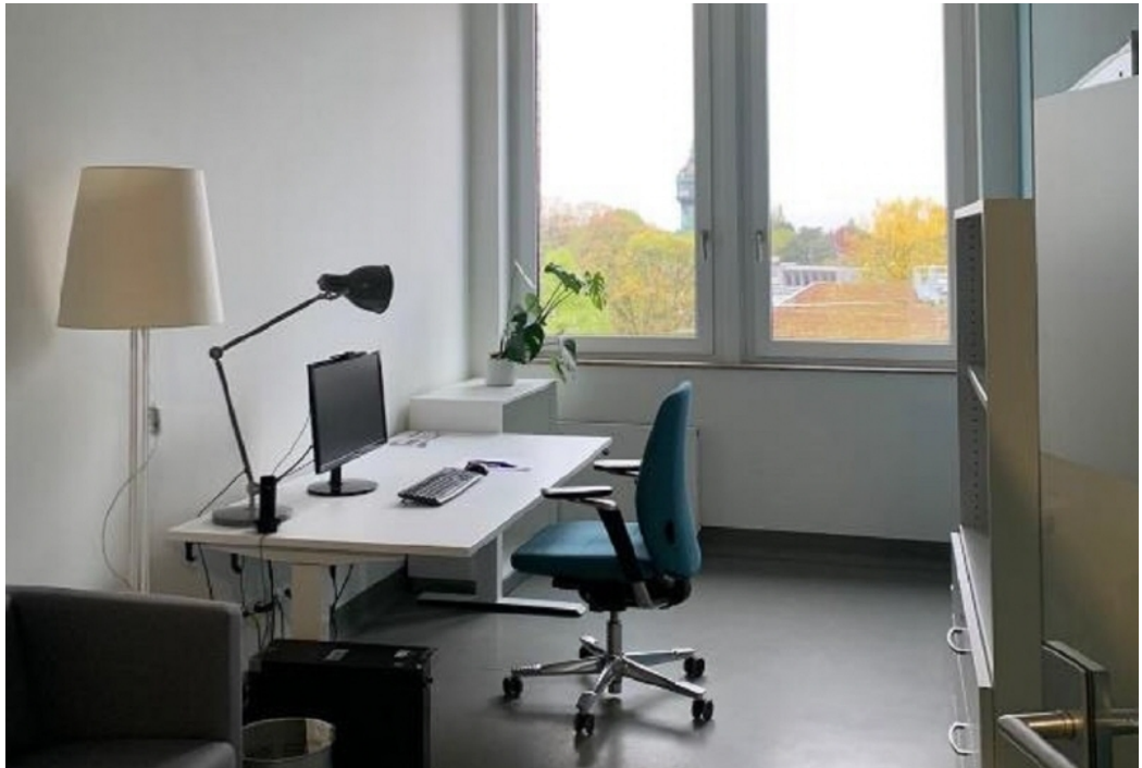
Innenansicht 2 - 4 OG