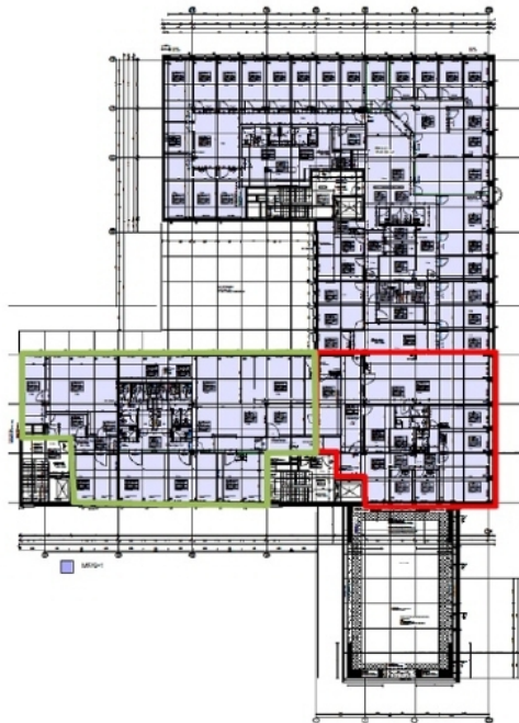
Grundriss 3 OG