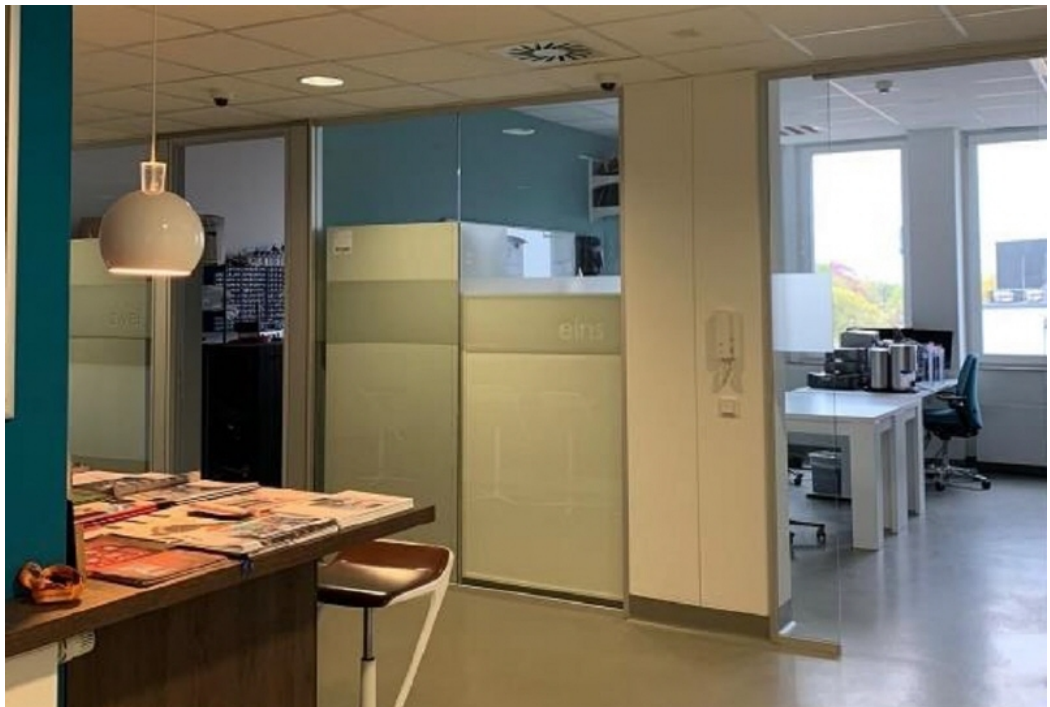
Innenansicht 1 - 4 OG