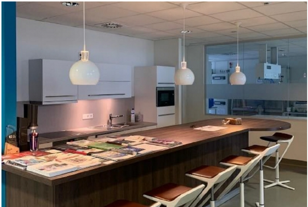
Innenansicht 3 - 4 OG