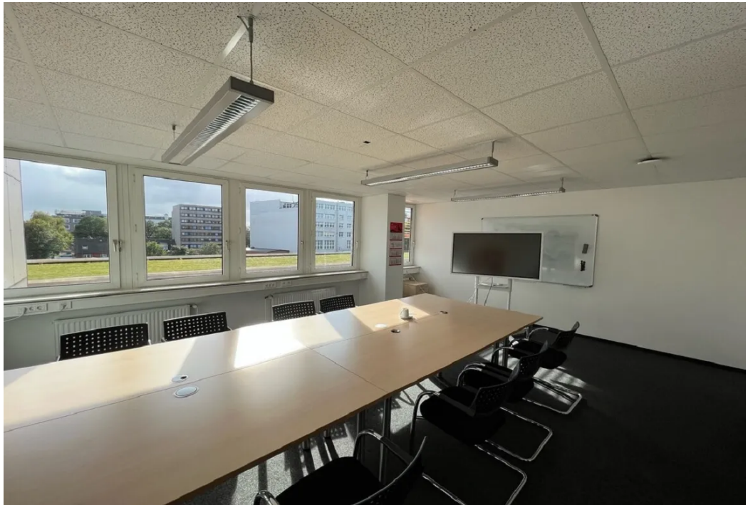
Beispiel Innenansicht 1 ALO-Center