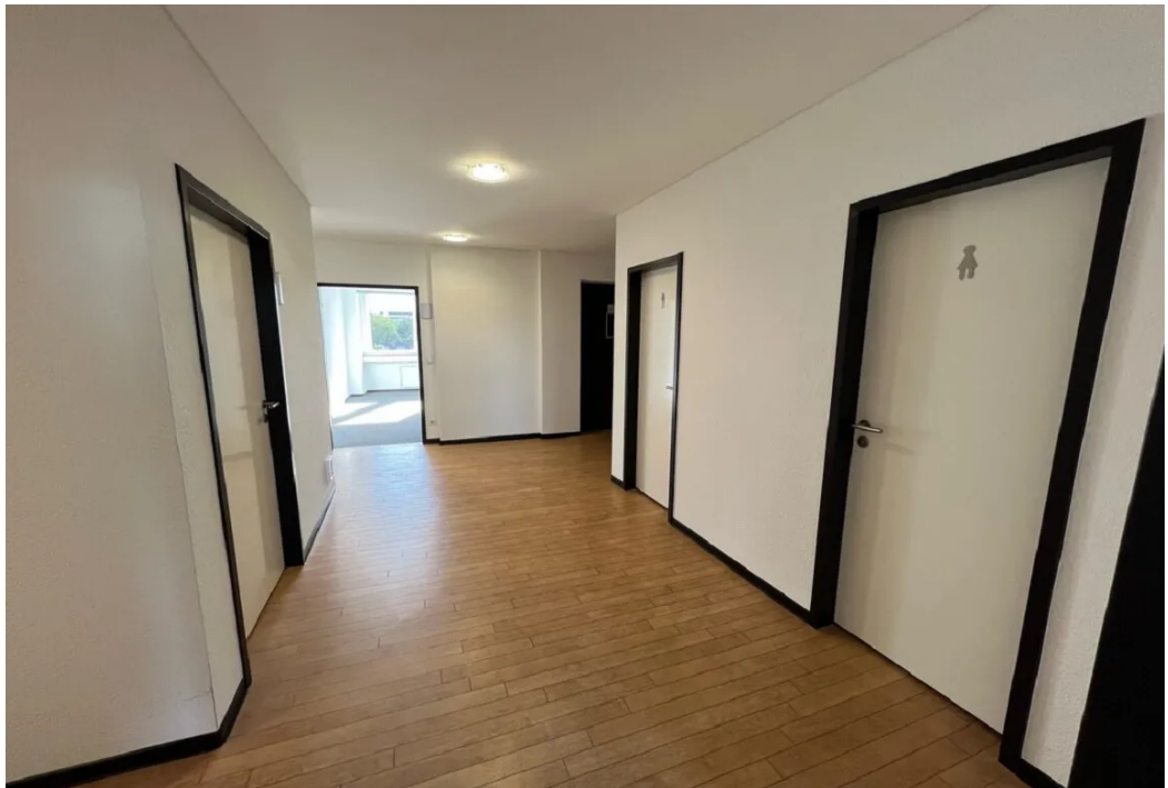
Beispiel Innenansicht 2 ALO-Center