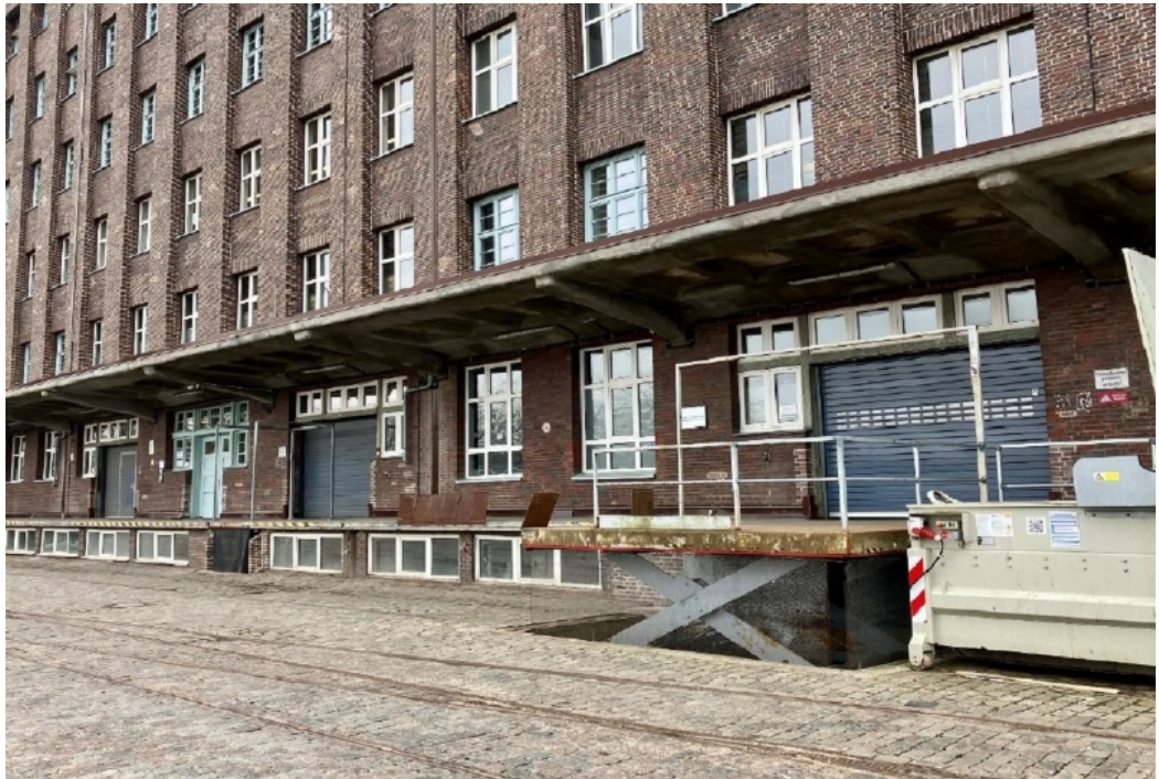
Vorderer Anlieferungsbereich mit Rampe