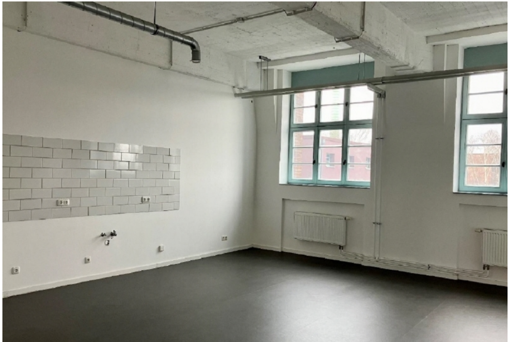
Aufenthaltsraum mit Küchenanschlüssen