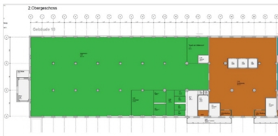
Grundriss 2 OG