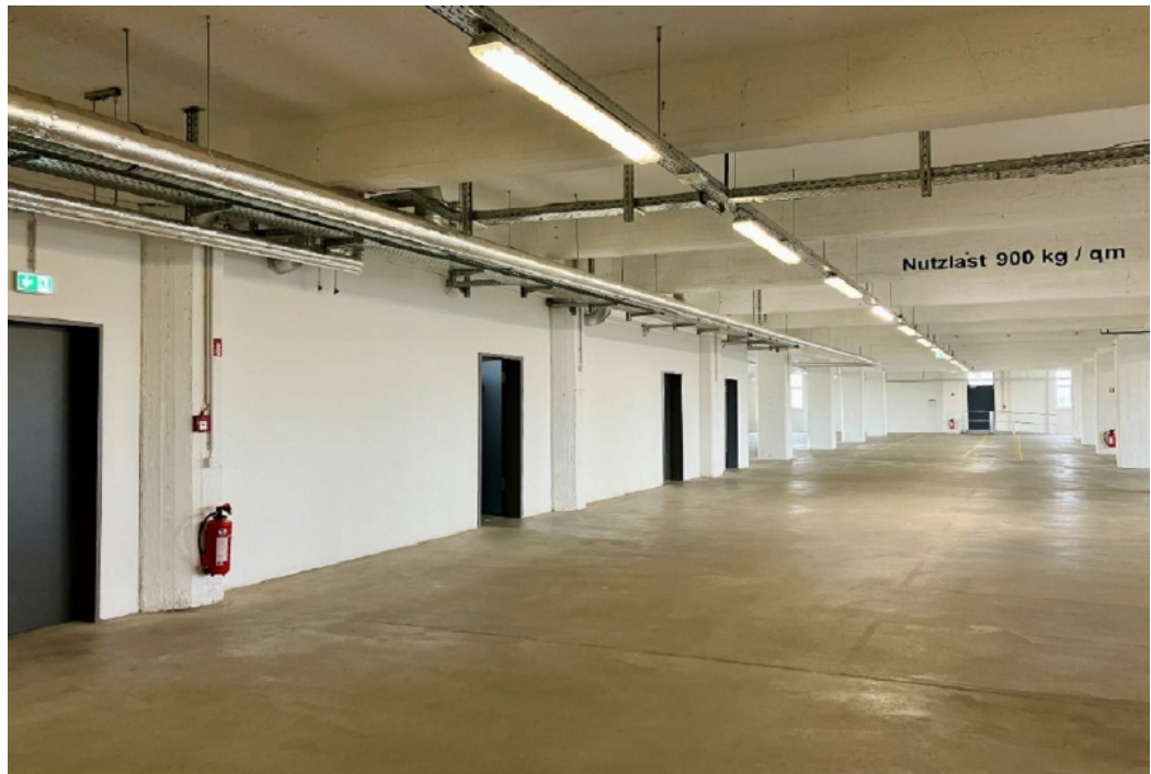
Ansicht Lagerfläche mit Sozialräumen links