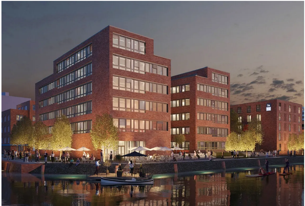
Aqua² Dock von der Wasserseite aus