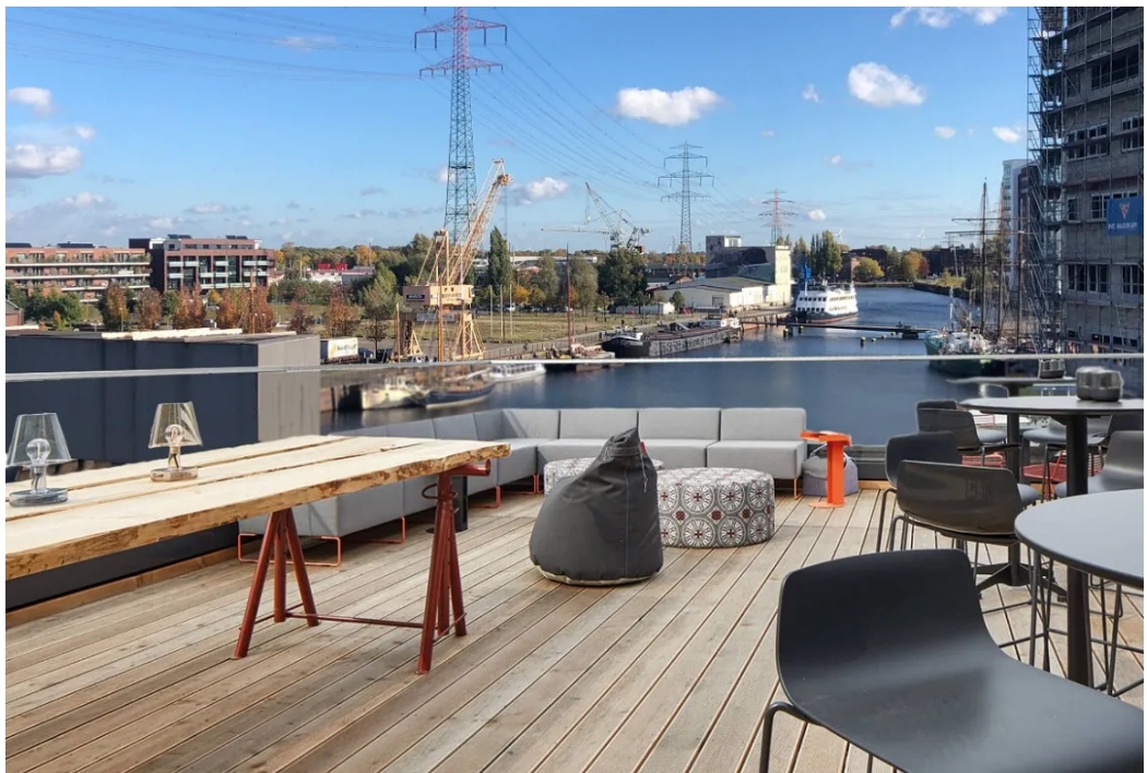
Blick von der Dachterrasse aus