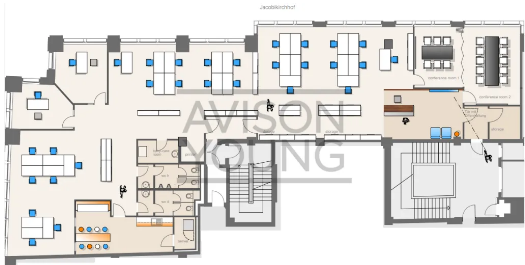
2. OG mit ca. 421 m 2