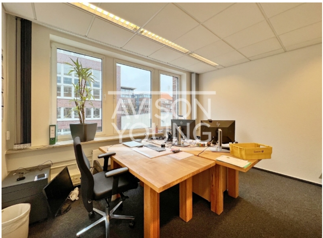
Haus B Innenansicht