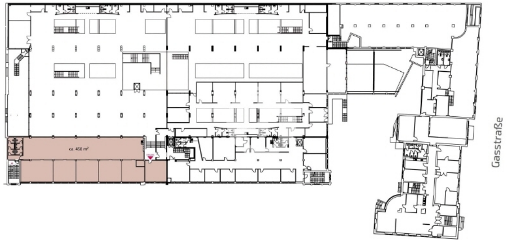
Gasstraße 16 - 1. Obergeschoss mit ca. 458 m 2