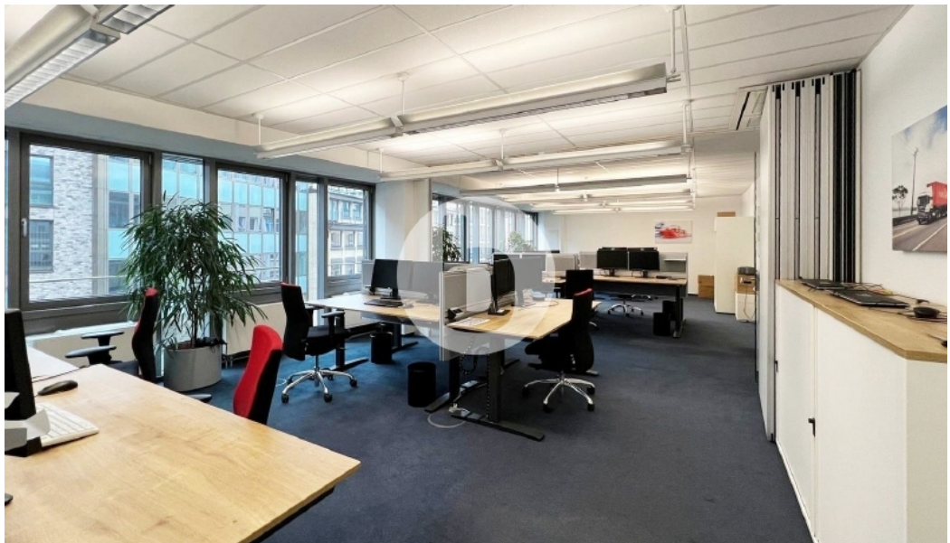
Innenansicht 5 OG