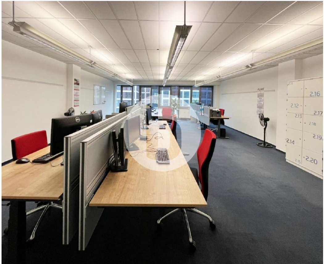
Innenansicht 5 OG