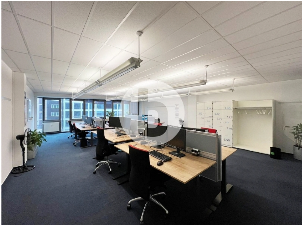
Innenansicht 5 OG