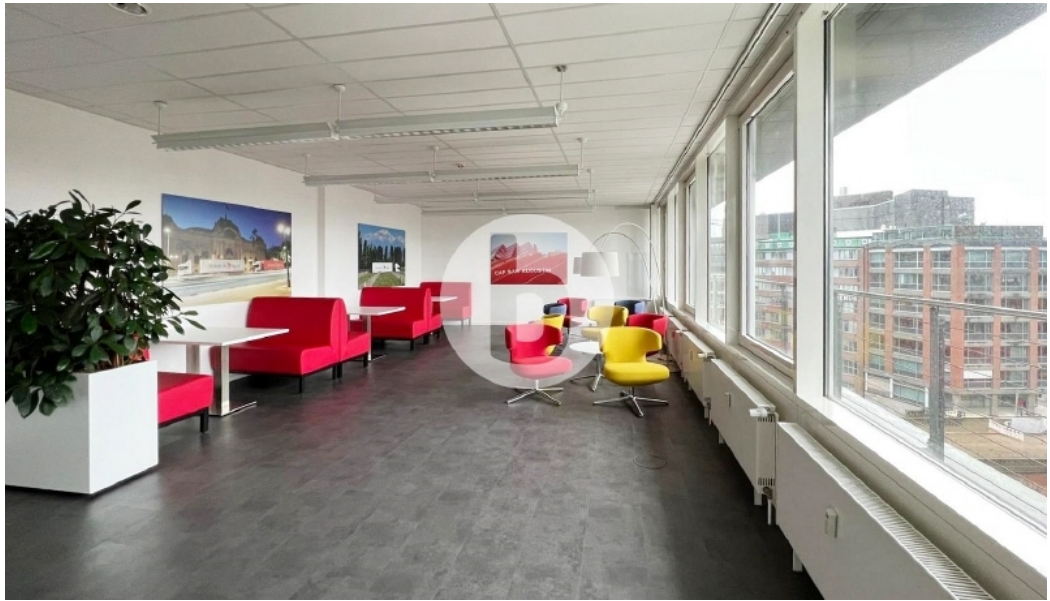
Innenansicht 6 OG