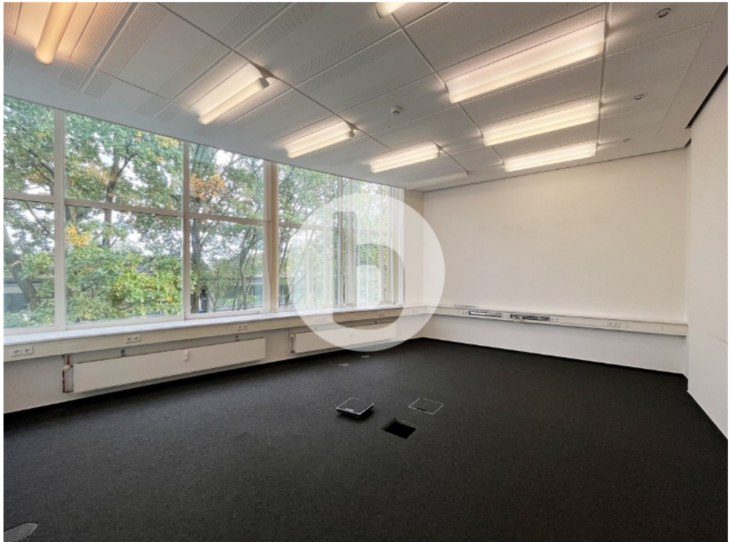
Innenansicht 3 OG