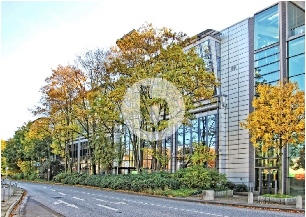
Mediencentrum Rotherbaum Rothenbaumchaussee Hamburg Bürogebäude Außenansicht