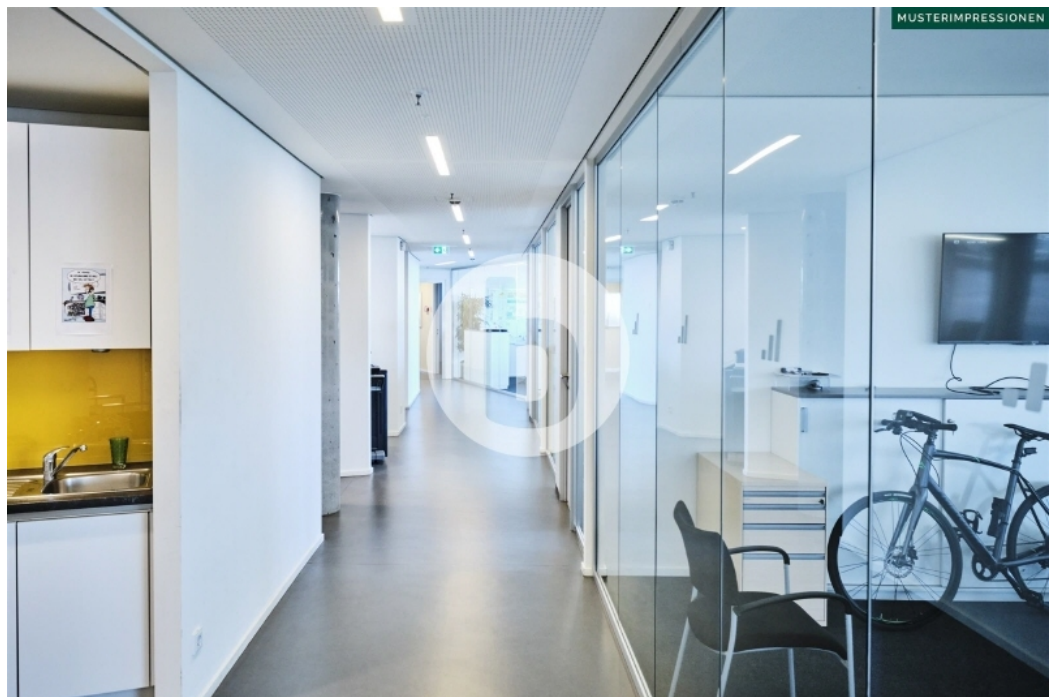
LES 1 Ludwig-Erhard-Straße 1 Hamburg City Büro Innenansichten