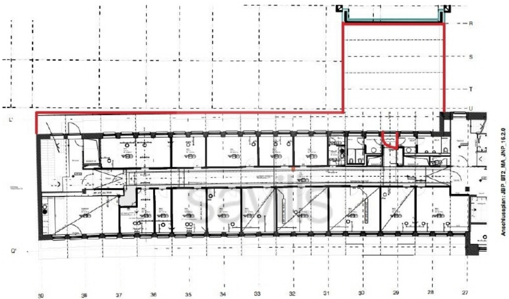
Grundriss Pilatuspool1, 6OG 23 Dachterrasse