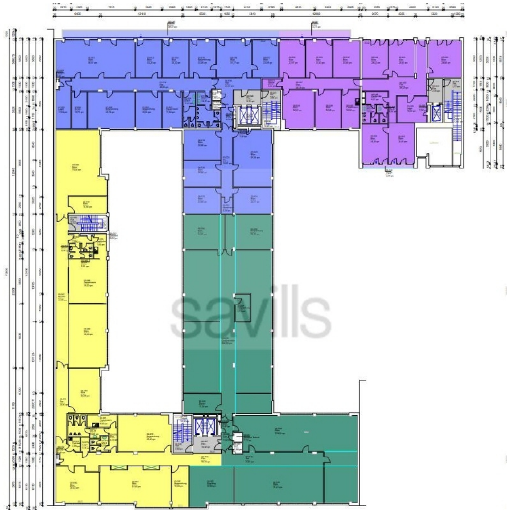
Wendensstraße 21 - Haus am Mittelkanal - 1 OG Gesamt