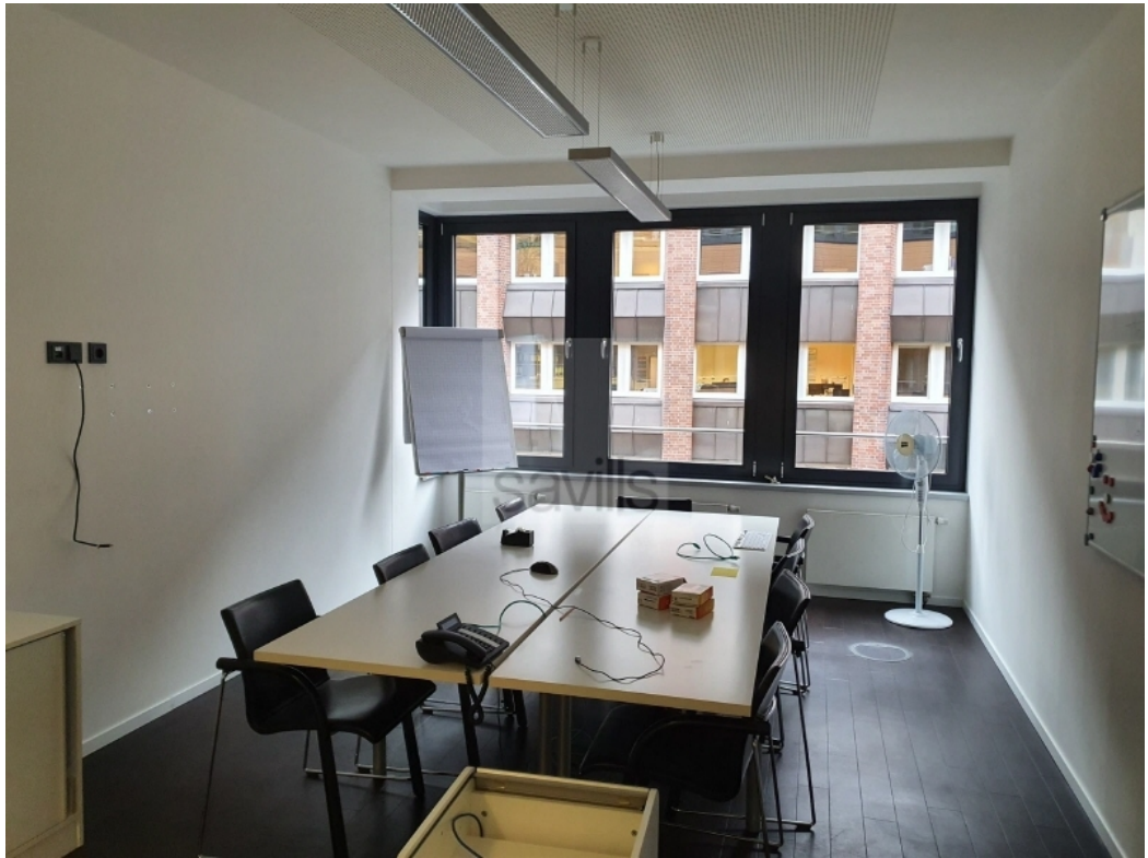
Wendenstraße 21 - Haus am Mittelkanal - Impression