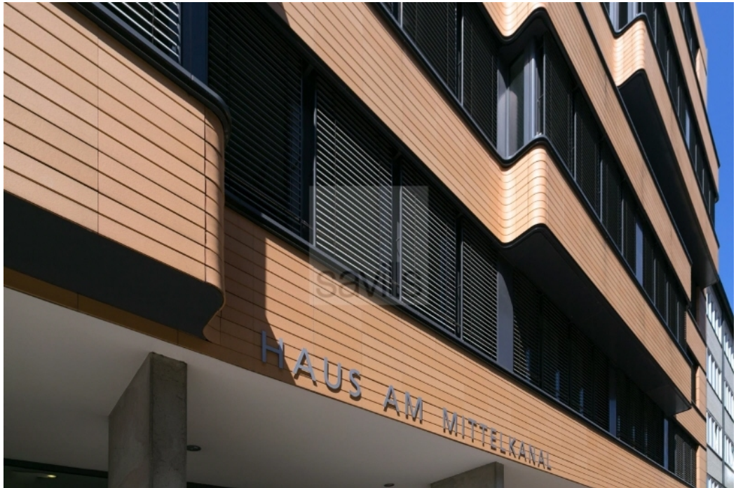
Wendenstraße 21 - Haus am Mittelkanal - Savills