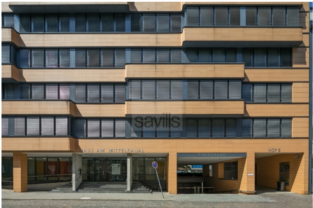
Wendenstraße 21 - Haus am Mittelkanal - Savills