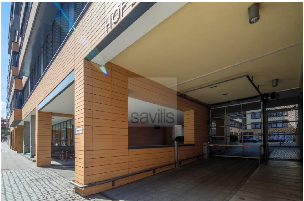
Wendenstraße 21 - Haus am Mittelkanal - Savills