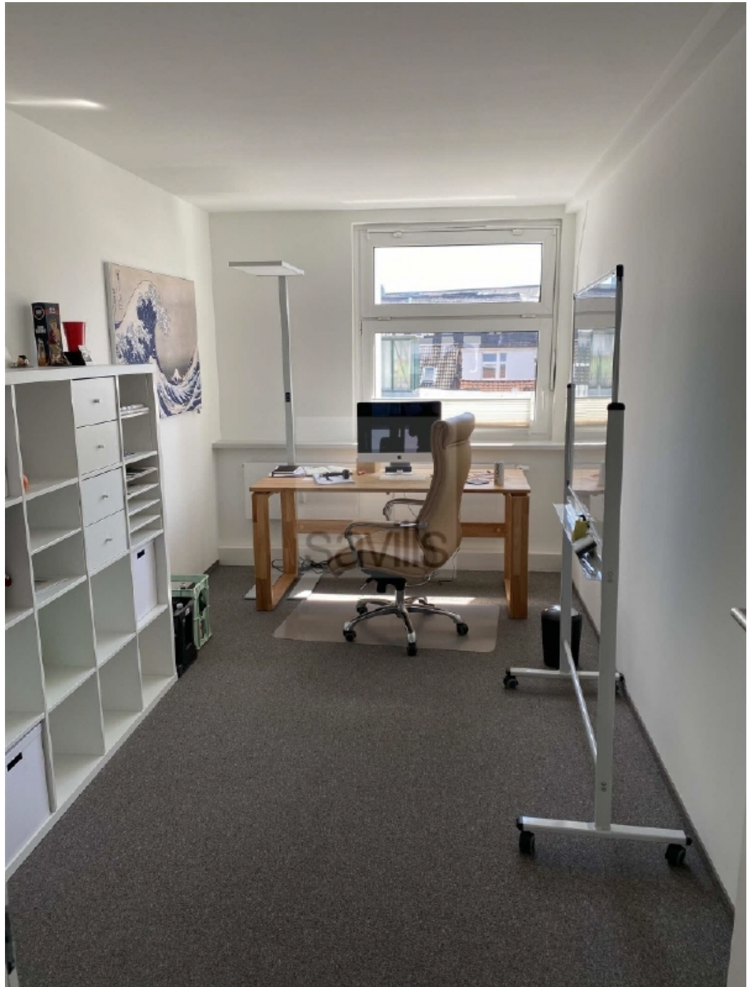
Schauenburgerstraße 49 - Büroansicht