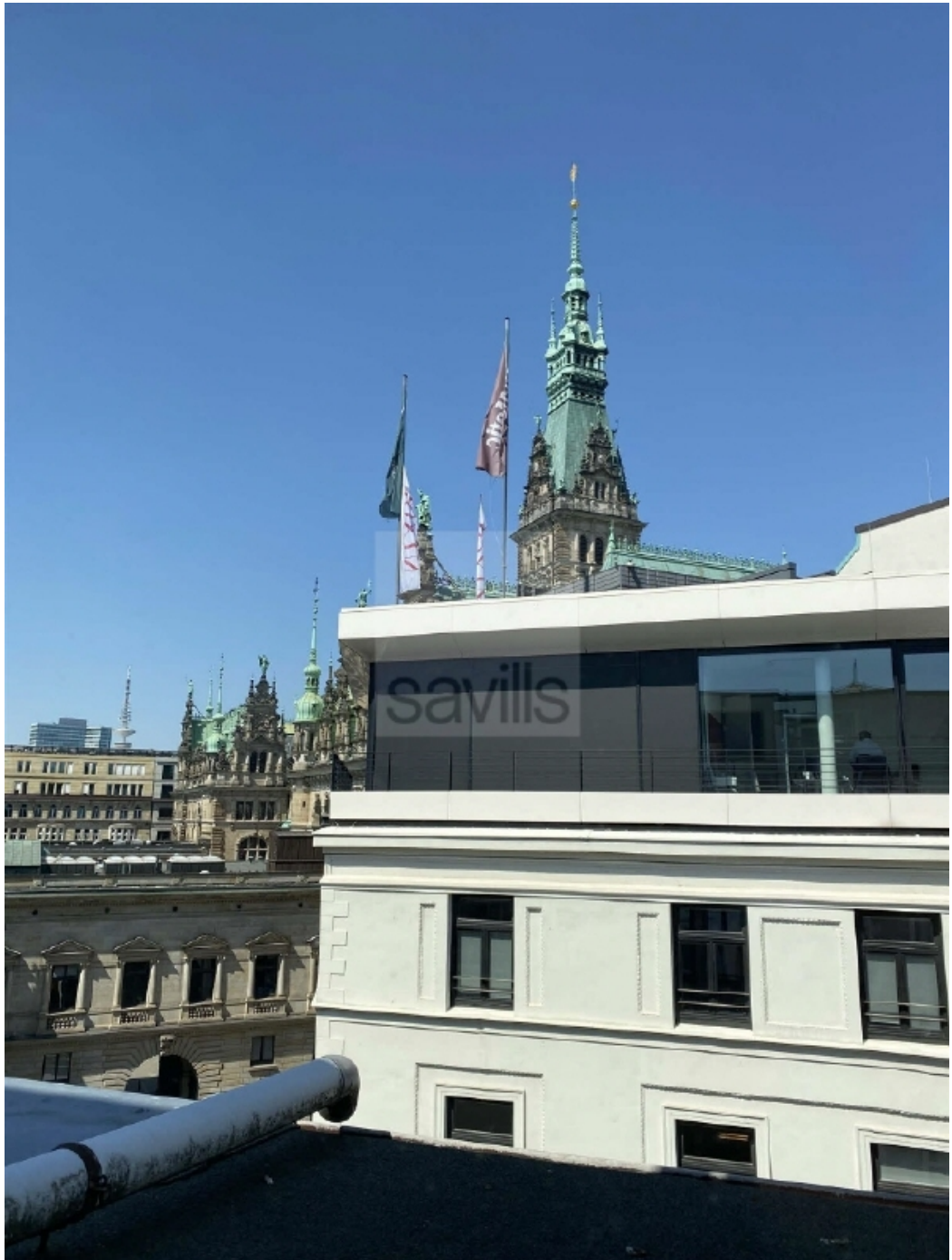
Schauenburgerstraße 49 - Ausblick