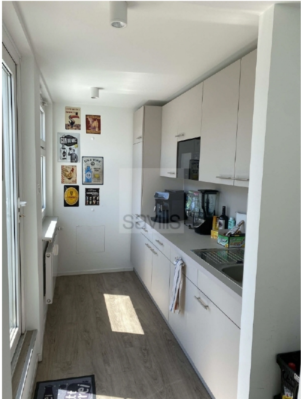
Schauenburgerstraße 49 - Küche