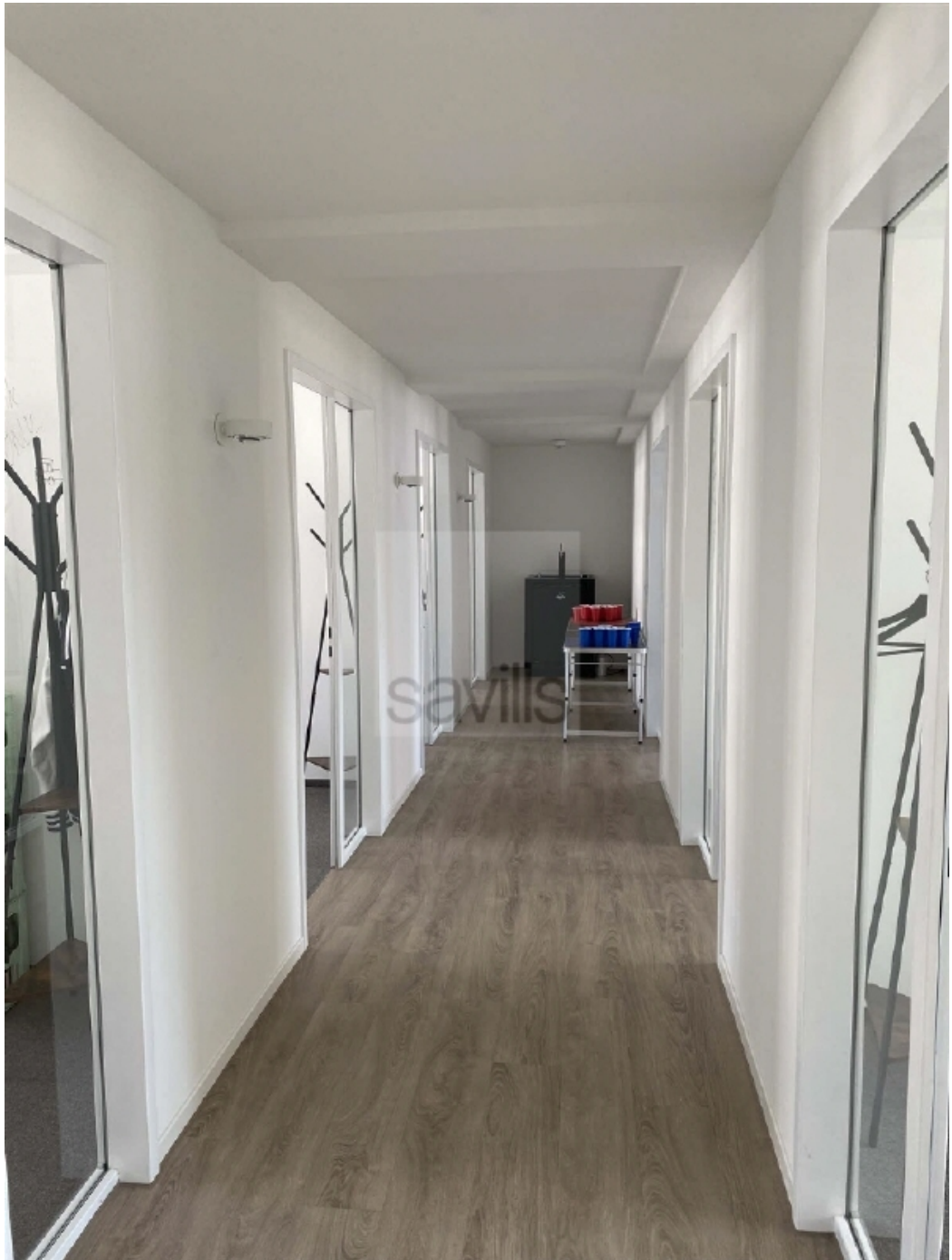
Schauenburgerstraße 49 - Flur