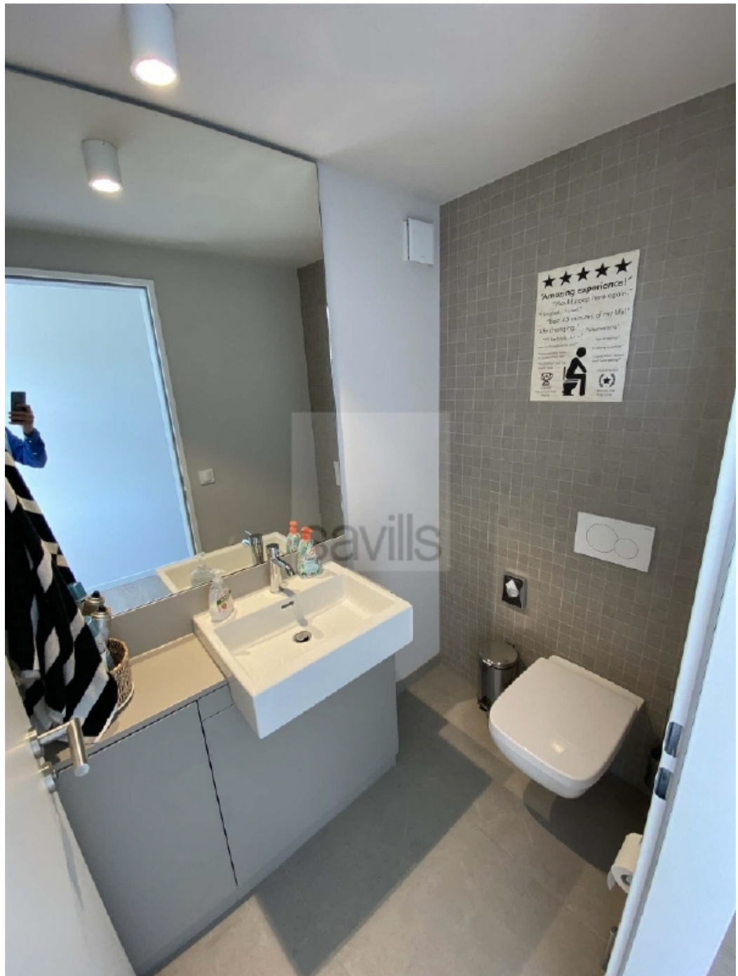
Schauenburgerstraße 49 - Toilette