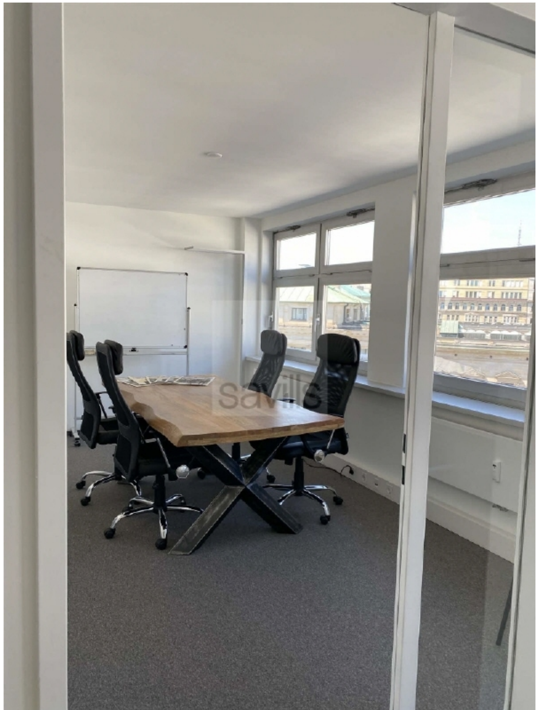
Schauenburgerstraße 49 - Konferenzraum