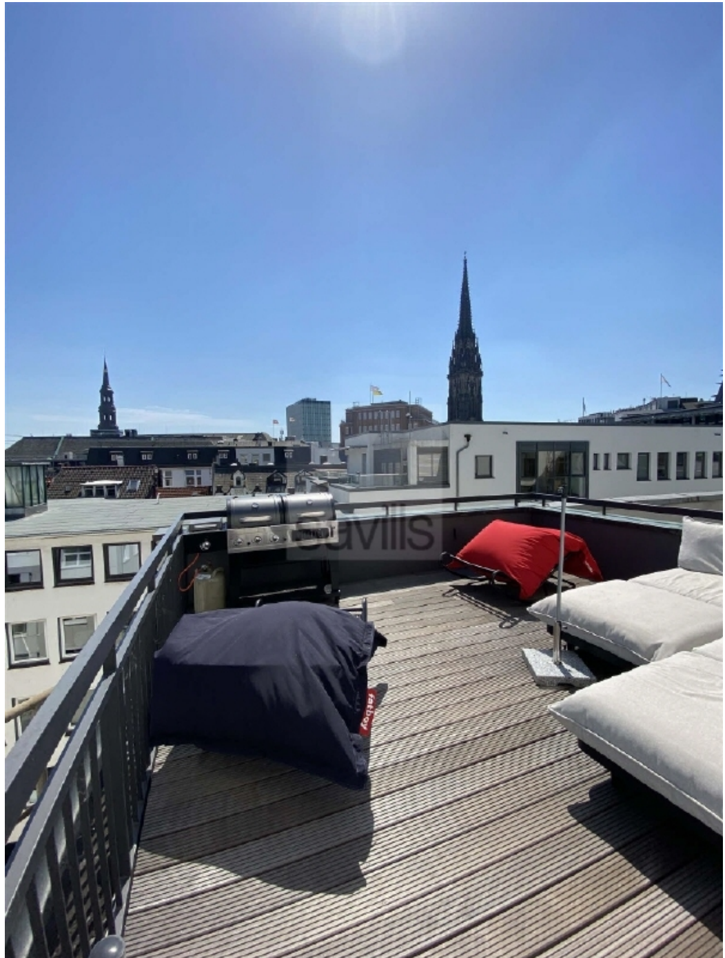
Schauenburgerstraße 49 - Terrasse