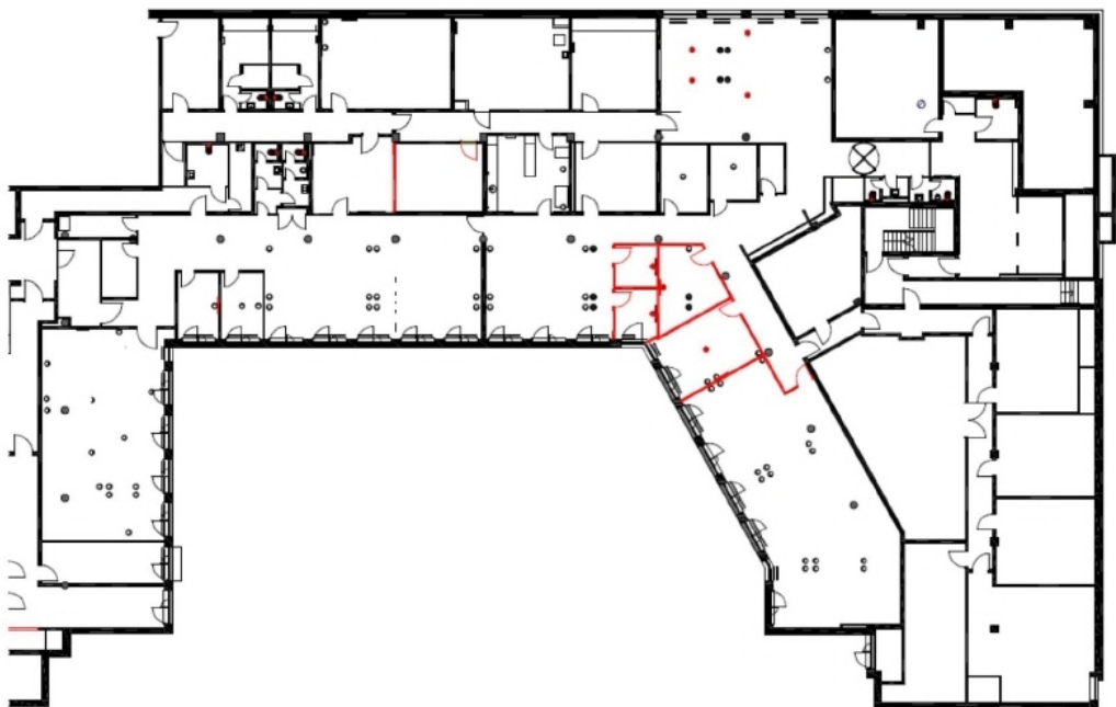
GR ZG ca 940qm